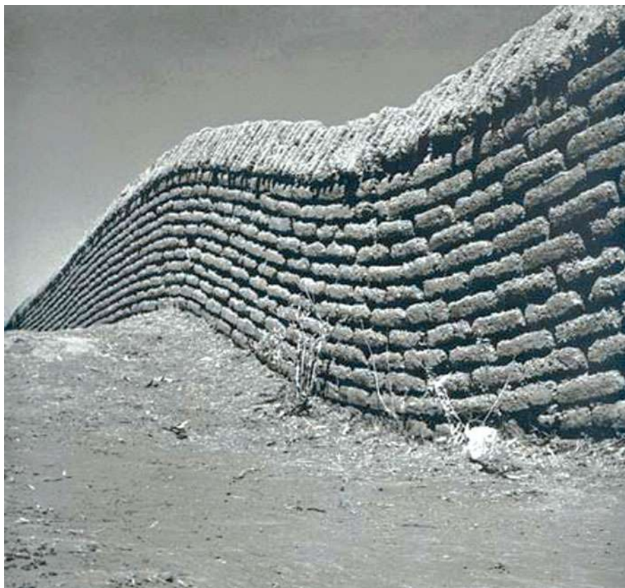
Barda tirada en un campo verde , Juan Rulfo, 1948.

Observeu atentament la fotografia següent, obra de Juan Rulfo, i responeu als apartats 2.1 i 2.2.