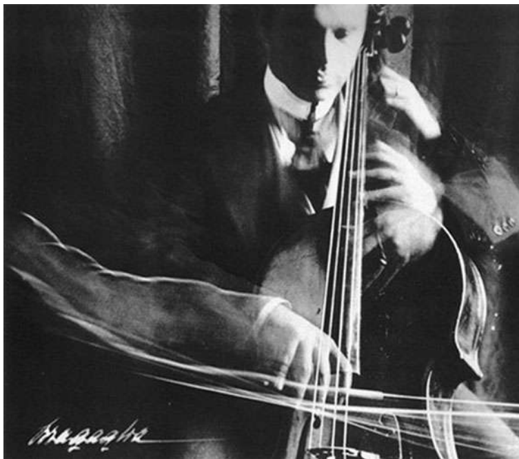
El violoncel·lista , A. G. Bragaglia, 1913.

Observeu atentament aquesta imatge, obra del fotògraf Anton Giulio Bragaglia, i responeu als apartats 2.1 i 2.2.