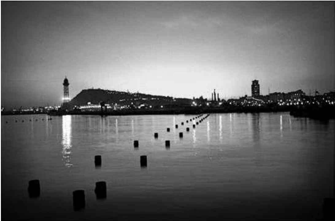
Port, Barcelona, Andreas Kierulf, 1994.

Observeu atentament la fotografia següent, obra del fotògraf català Andreas Kierulf, i responeu als apartats 2.1 i 2.2.