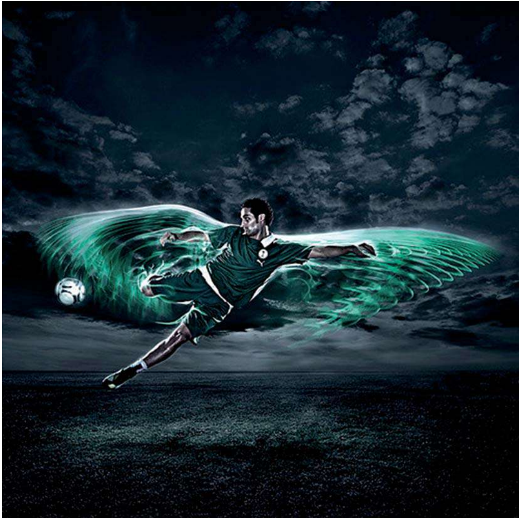
Cameroon football selection, Andy Green, 2010.

Observeu atentament la imatge següent i responeu als apartats 2.1 i 2.2.