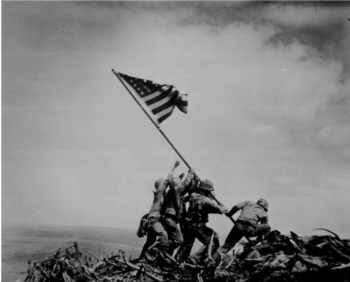
Raising the Flag on Iwo Jima , Joe Rosenthal, 1945.

Observeu atentament la fotografia següent, obra del fotògraf Joe Rosenthal, i responeu a les qüestions 2.1, 2.2 i 2.3.