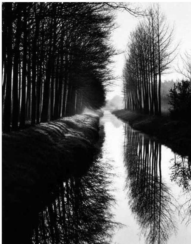
Canal , Brett Weston, 1971.