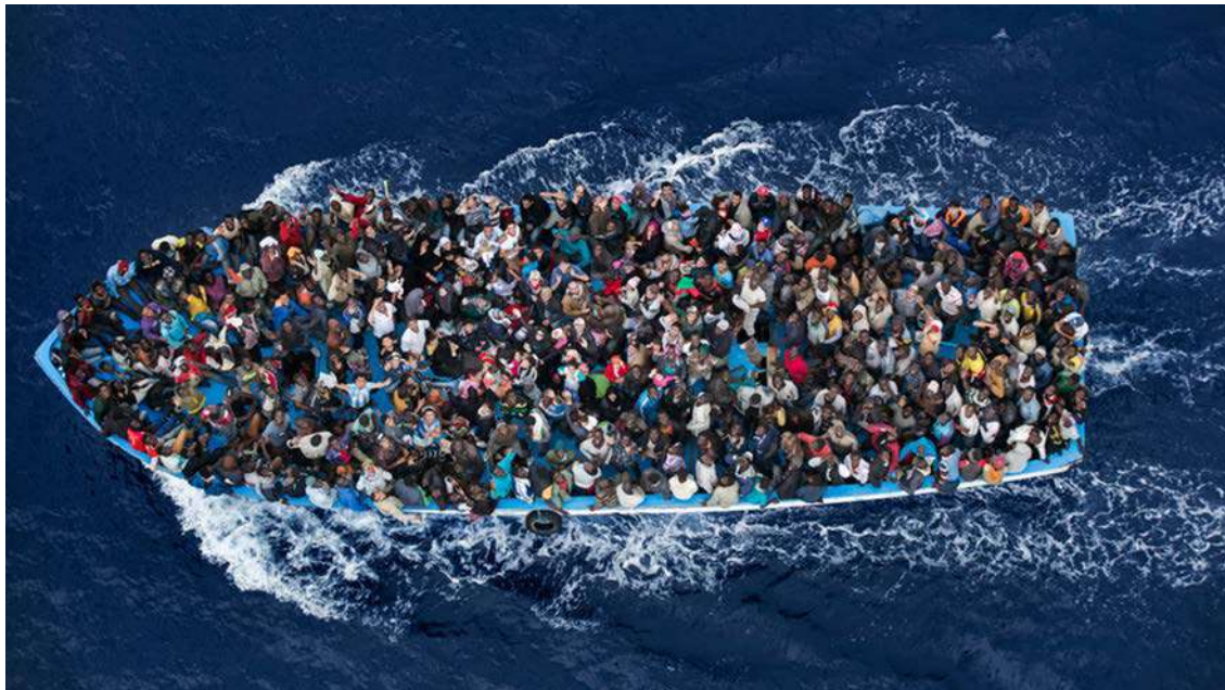
Rescue operation , Massimo Sestini, 2014.

Observeu atentament la fotografia següent, obra del fotògraf Massimo Sestini, i responeu a les qüestions 2.1, 2.2 i 2.3.