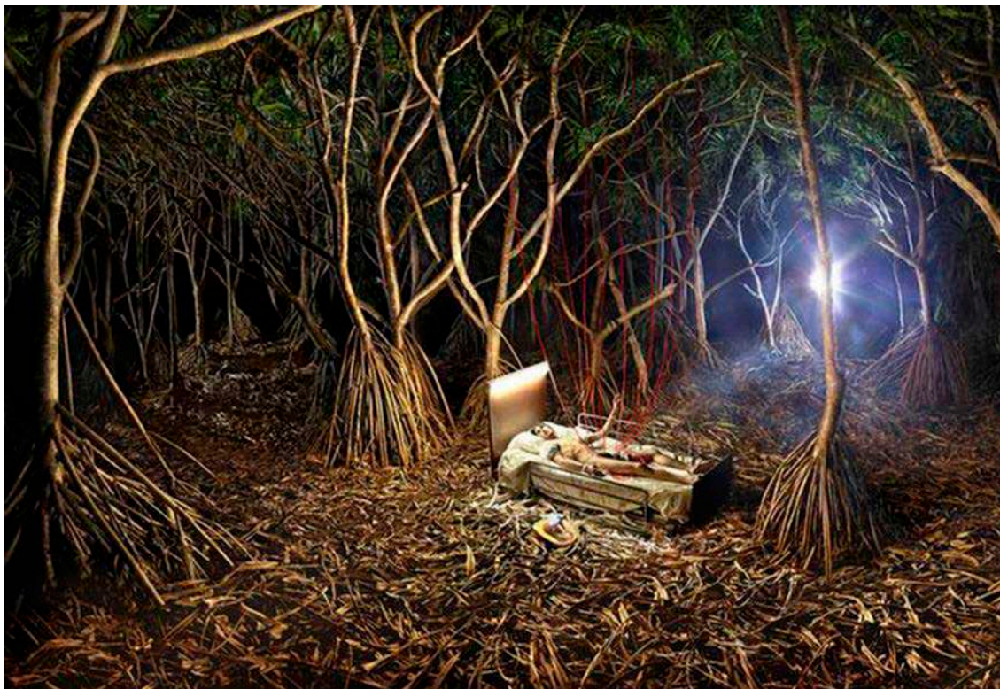
Transfusion , David LaChapelle, 2015.

Observeu atentament la fotografia següent, obra del fotògraf David LaChapelle, i respon-neu a les qüestions 2.1, 2.2 i 2.3.