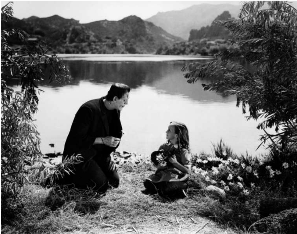
Fotograma de Frankenstein (1931), de James Whale.

Observeu atentament el fotograma següent de la pel·lícula Frankenstein (1931), de James Whale, i responeu a les qüestions 2.1, 2.2 i 2.3.