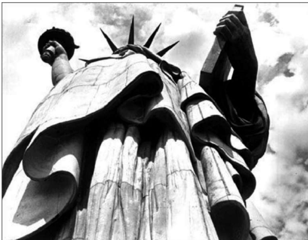
The Statue of Liberty , Margaret Bourke-White, 1930.

Observeu atentament la fotografia següent, obra de la fotògrafa Margaret Bourke-White, i responeu a les qüestions 2.1, 2.2 i 2.3.