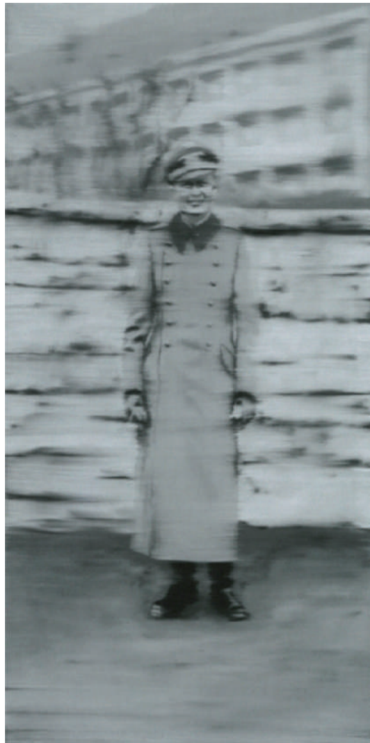
IMATGE B. Gisèle Freund. Maig de 1932 al centre de Frankfurt , 1932. Còpia fotogràfica en blanc i negre, mides variables. Col·lecció particular.