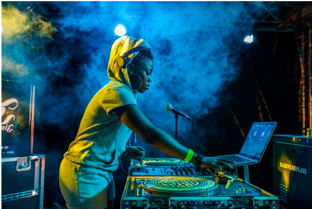
IMATGE 4. Andrew Esiebo (1978- ). Fragment d'una fotografia del projecte Alter Gogo .

A: Andrew Esiebo [en línia]. < http://www.andrewesiebo.com/highlife > [Consulta: 2 octubre 2018].