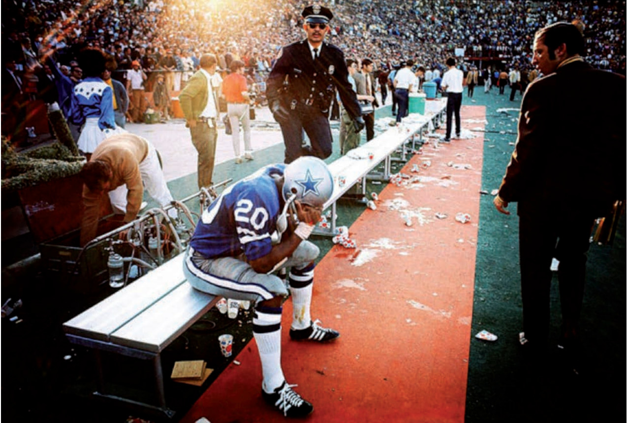
IMATGE 3. Walter Iooss (1943- ). Mel Rento. Superbowl, Miami. Fotografia. A: Walter Iooss [en línia]. < http://walteriooss.com/portfolios/5 > [Consulta: 10 octubre 2016].