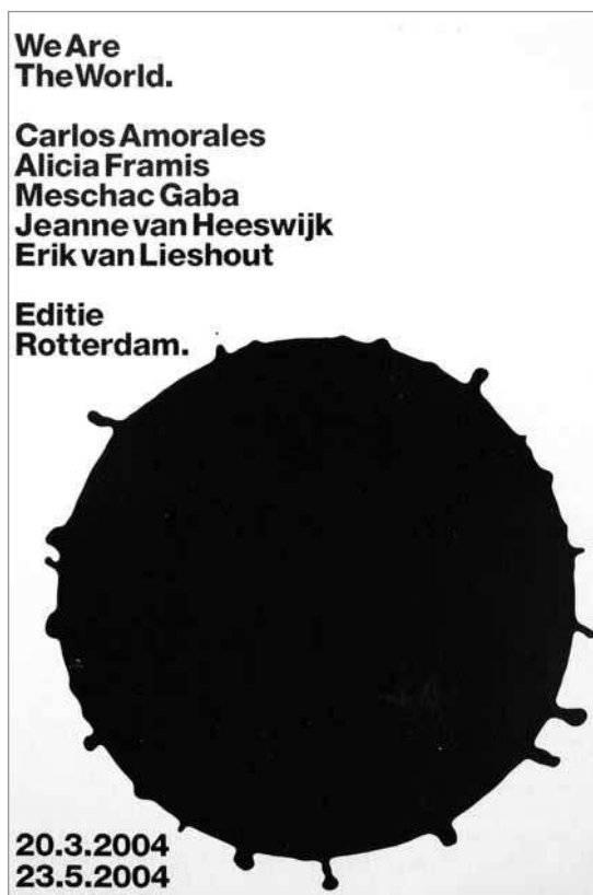
IMATGE C. Cartell d'Experimental Jetset per a una exposició a la Biennial de Venècia (2004).

2.1. Els cartells que es mostren en les imatges C i D presenten algunes semblances i algunes diferències. Exposeu-les de manera ordenada.