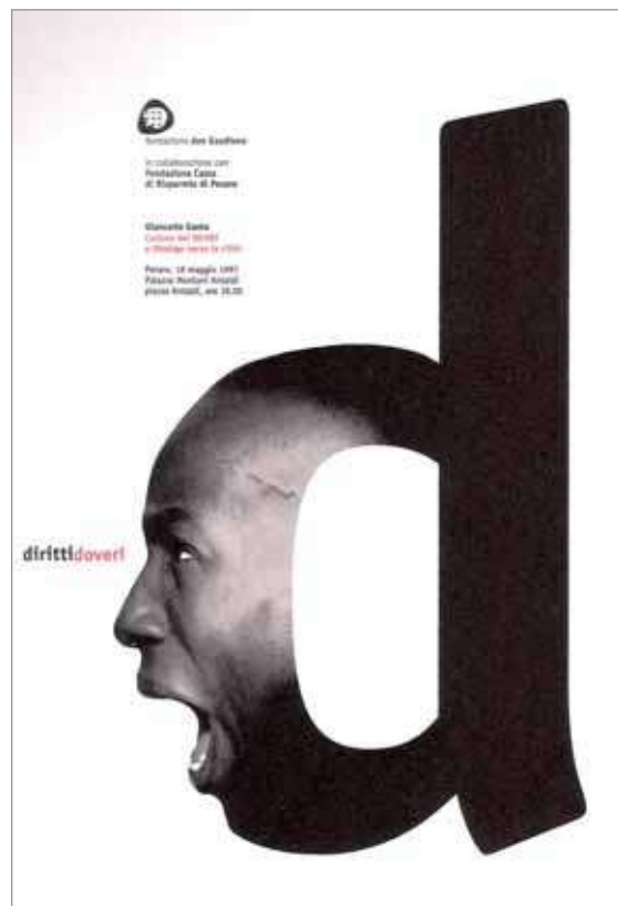
IMATGE D. Cartell de Leonardo Sonnoli per a un congrés sobre drets i deures dels ciutadans a les àrees metropolitanès (1997).