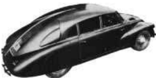
IMATGE A. Tatra V8. F. Porsche, 1938.