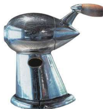
IMATGE B. Afilallapis. R. Loewy, 1934.