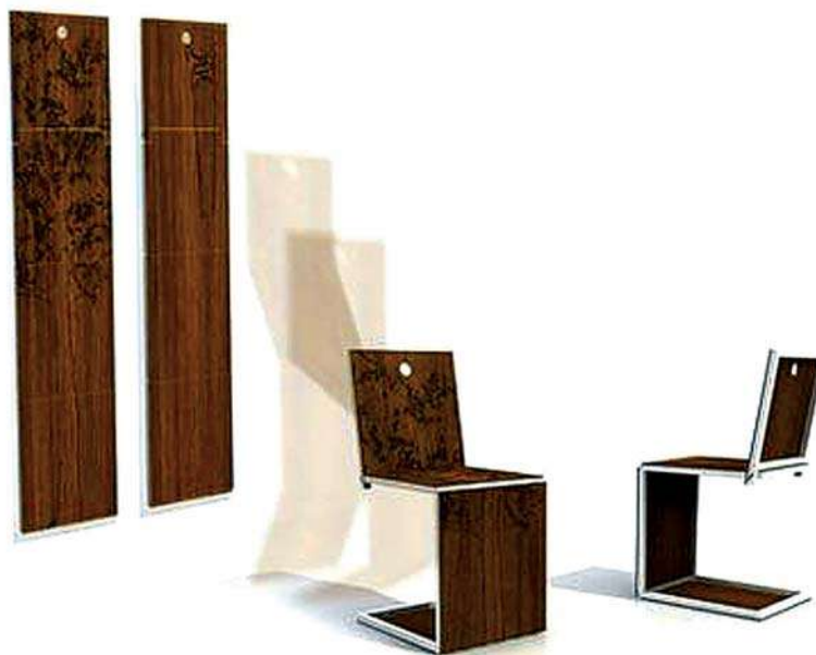
IMATGE D. «Pick Chair». Studio Dror. Nova York.

Comenteu els avantatges i els inconvenients d'aquest disseny.