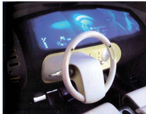
IMATGE C. Concepte de comandaments activables amb la veu (prototip no fabricat). Ford Motor Company, 2000.