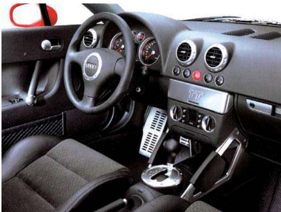
IMATGE B. Audi TT, 2004.