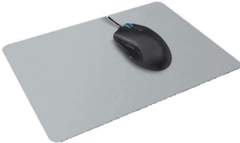
IMATGE F. Estoreta i ratolí d'ordinador

La mida de l'estoreta ha de ser 22 \times 17 cm i s'ha d'estampar a una tinta.