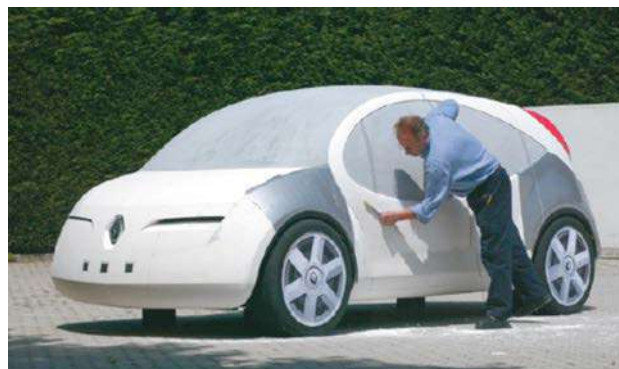
IMATGE A. Maqueta d'un automòbil Renault

La imatge A mostra un operari treballant en l'elaboració de la maqueta d'un automòbil i la imatge B, el prototip d'un automòbil presentat a la Fira de l'Automòbil de Frankfurt del 2013. Les dues representacions de vehicles corresponen a objectes tridimensionals, però hi ha algunes diferències entre l'una i l'altra.