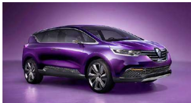
IMATGE B. Prototip del Renault Initiale presentat a la Fira de l'Automòbil de Frankfurt, 2013