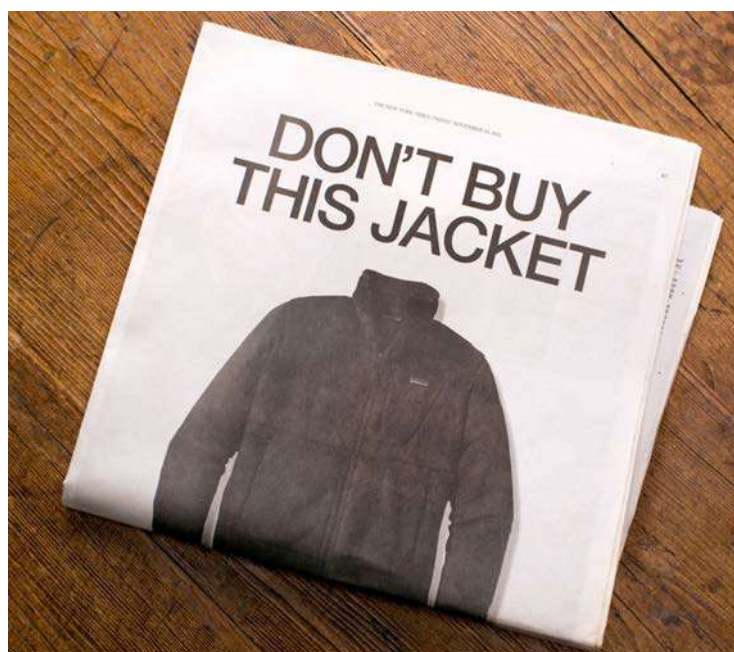
IMATGE B. Anunci a tota pàgina publicat a The New York Times , desembre del 2011