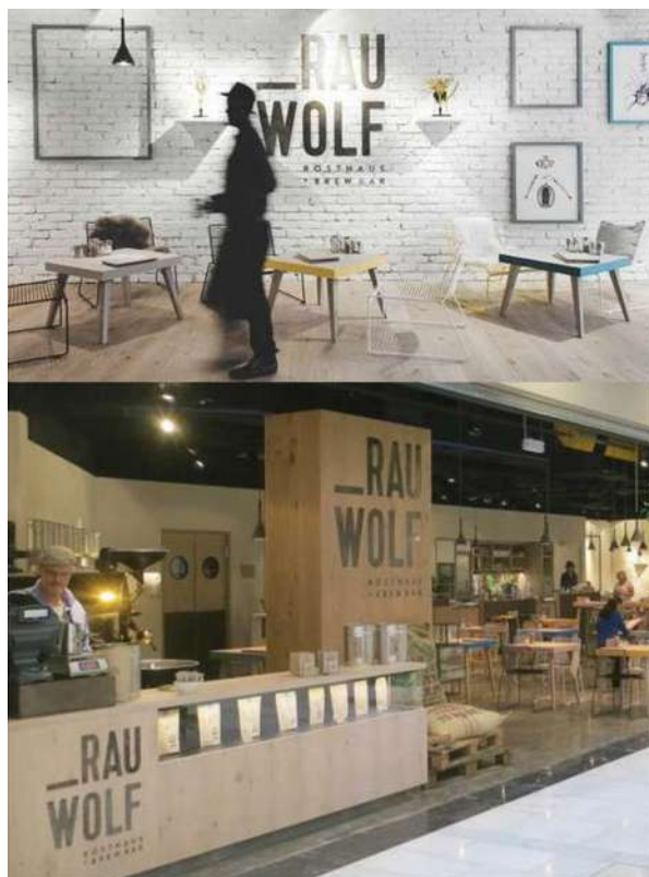
IMATGE F. A l'esquerra, dos espais de la cadena de cafeteries i, a la dreta, el logotip de l'empresa

La imatge F mostra la imatge gràfica de la cadena de cafeteries Rauwolf.