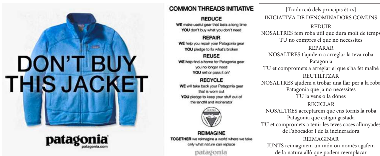
IMATGE A. Imatge publicitària de la campanya «Don't buy this jacket» («No compres aquesta jaqueta») i principis ètics de l'empresa Patagonia

Mònica CARBONELL. «Patagonia: una marca que vende más pidiendo a sus clientes que compren menos». ESADECREAPOLIS [en línia] (13 setembre 2013)