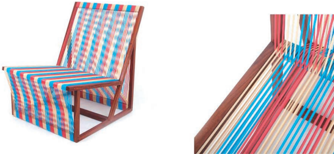
IMATGE E. Cadira Olga. Boulevard 03

Prenent aquesta cadira com a referent, desenvolueu el disseny d'un tamboret de bar. Per a fer-ho, podeu agafar com a referència les mides següents: 750 mm d'alçària, 330 × 330 mm de seient i 440 × 440 mm de base.