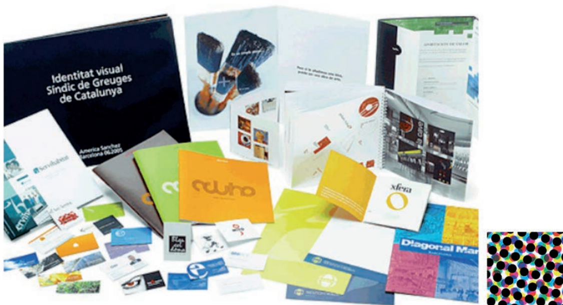
IMATGE A. Mostres d'impressió òfset i ampliació al 500 % d'un detall

La impressió òfset (en anglès, offset printing ) és una tècnica d'impressió que permet la reproducció de textos i imatges. Observeu la imatge A i contesteu les dues qüestions que hi ha a continuació.