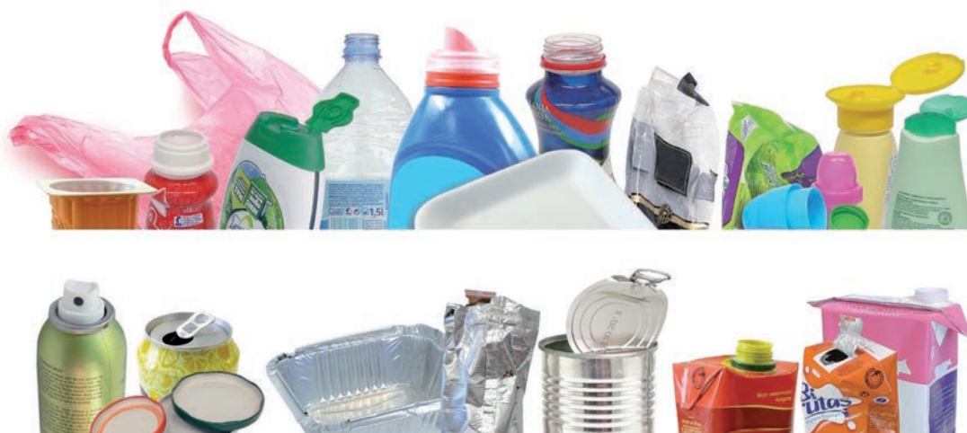
IMATGE A. Mostres d'envasos lleugers

Adaptació d'un article publicat a la premsa sobre la Setmana Europea de la Prevenció de Residus