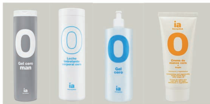
IMATGE A. Mostra de productes de la línia Cero, aptes per a tot tipus de pell