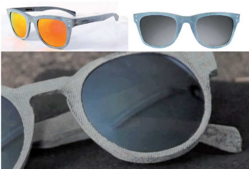
IMATGE C. Ulleres de sol Palens Denim, fabricades a partir de la superposició de diverses capes de roba texana reciclada

La imatge C mostra unes ulleres de sol fabricades mitjançant la superposició de teles texanes encolades i premsades. En la imatge D podem observar el procés de tall amb làser de texans reciclats i el logotip de la marca.