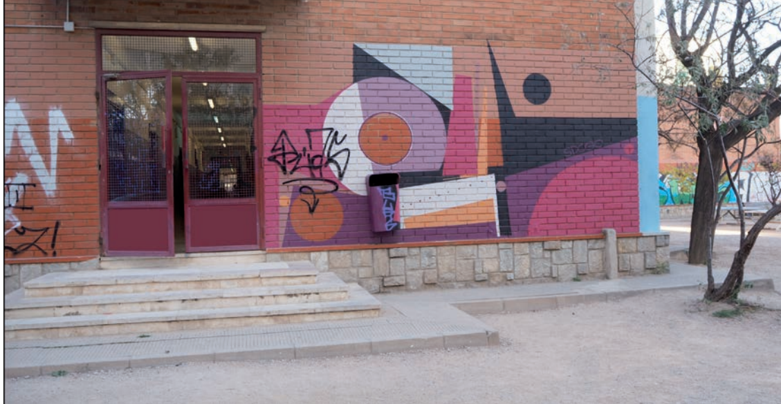
IMATGE C. Entrada a un institut d'educació secundària

En la imatge C podem observar l'entrada a un institut d'educació secundària, que té unes escales amb uns graons de 15 cm d'alçària. Com podem apreciar, aquesta entrada no és accessible per a persones amb cadira de rodes.