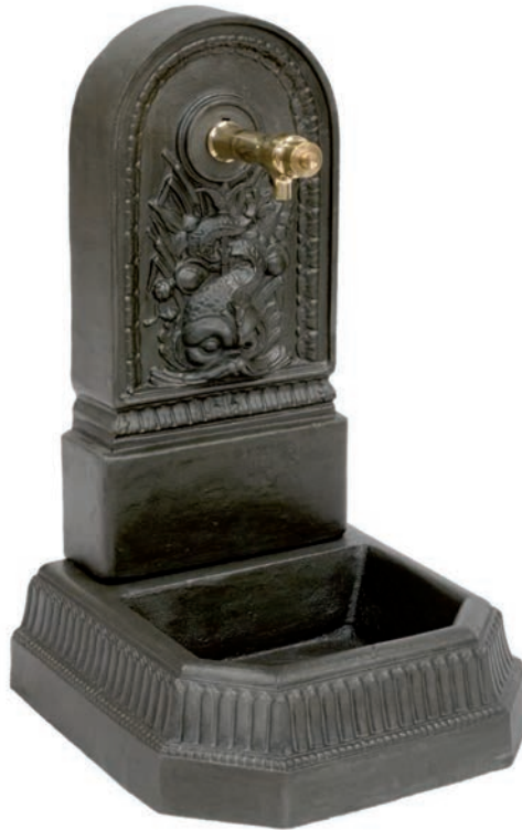
IMATGE F. Font que es vol substituir

Elaboreu el disseny d'una nova font segons les observacions esmentades i indiqueu-ne les mides.