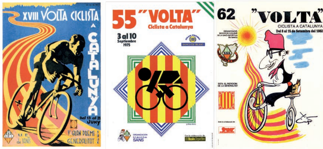
IMATGE B. Cartells de la Volta Ciclista a Catalunya

En la imatge B es mostren els cartells de les edicions de la Volta Ciclista a Catalunya dels anys 1936, 1975 i 1982, respectivament.