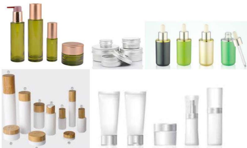
IMATGE D. Diferents tipus d'envasos per a productes d'higiene corporal

També cal que plantegeu, en termes molt generals, on col·locaríeu aquest logotip en una col·lecció d'envasos de mides i formes diferents. En la imatge D podem observar alguns envasos comercials que us poden servir com a font d'inspiració. Proposeu un mínim de quatre aplicacions del vostre logotip d'Oè en envasos de productes ben diferenciats (per exemple: un pot de bàlsam labial, una pastilla de sabó de mans, un pot petit de crema facial, una ampolla de xampú o un pot de crema corporal), de manera que tots els productes tinguin una cohesió gràfica i s'identifiqui ràpidament que es tracta de la mateixa marca.