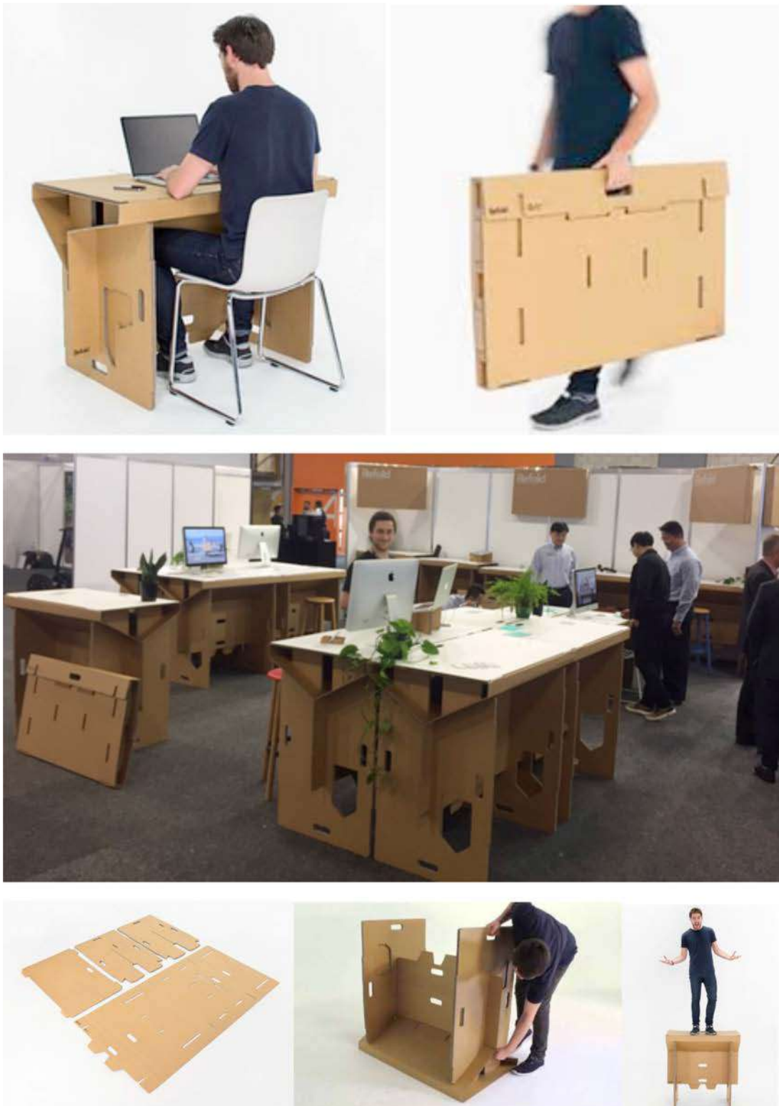
IMATGE B. Fotografies de l'escriptori Refold, dissenyat per Fraser Callaway, Oliver Ward i Matt Innes (Nova Zelanda)

En la imatge B podem observar fotografies de l'escriptori de cartró ondulat Refold. L'escriptori és 100 % reciclable i fàcil de transportar, ja que es pot plegar, i es munta en dos minuts. Segons els dissenyadors, aquestes característiques poden contribuir a canviar la manera com treballem.