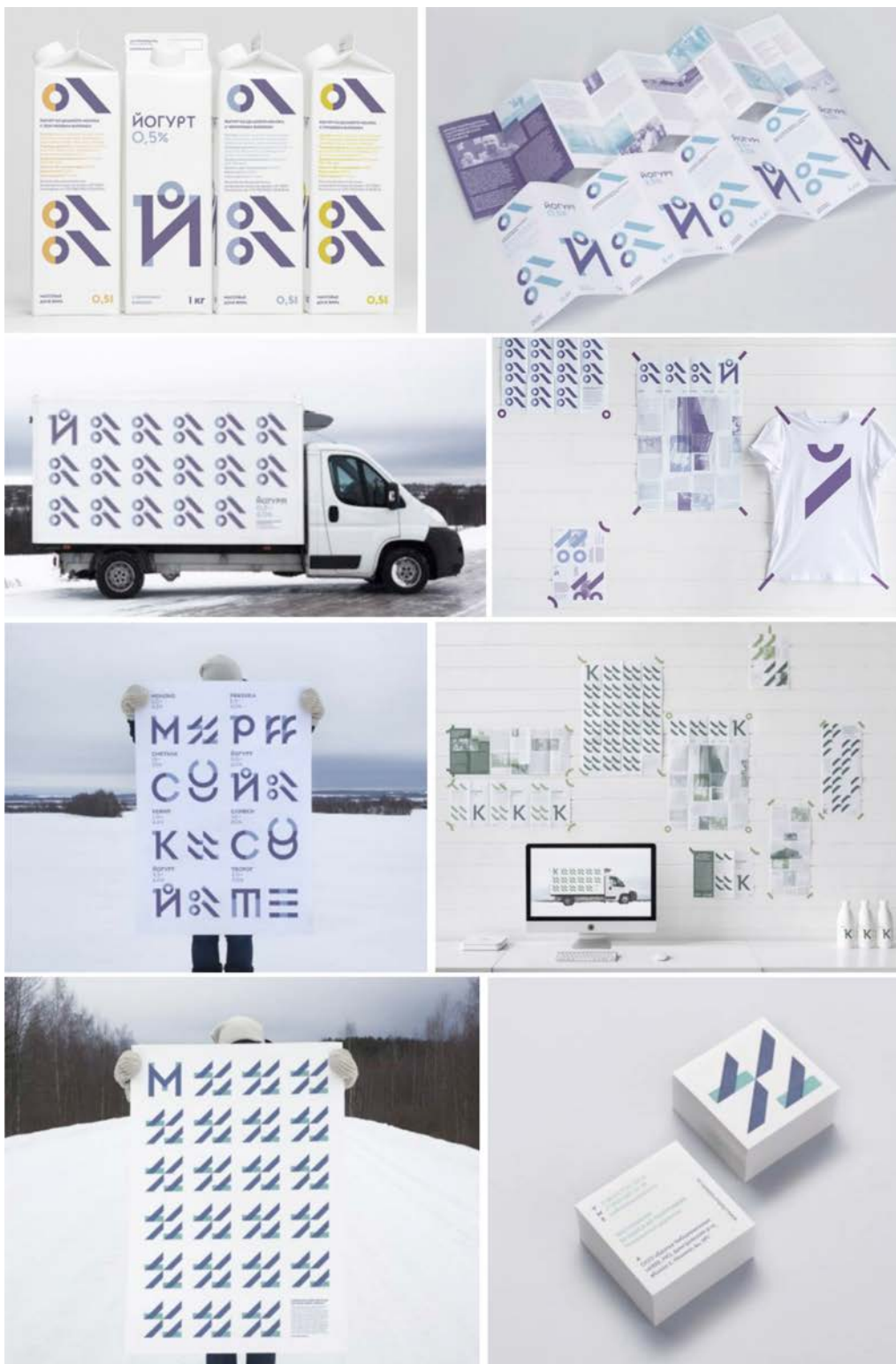
IMATGE A. Projecte d'imatge gràfica de la marca de productes làctics The Family Farm of Cheburashkini Brothers. Ermolaev Bureau

En la imatge A podem observar diversos elements que formen part del projecte d'imatge corporativa d'una marca russa de productes làctics guardonat als European Design Awards 2015.