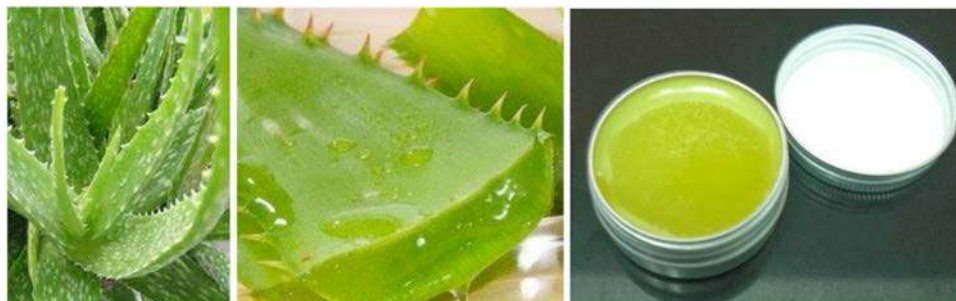
IMATGE C. Detall d'un Aloe vera , secció d'una fulla i bàlsam labial elaborat amb aquesta planta

Una empresa dedicada als productes d'higiene corporal comercialitza una nova línia de productes d'àloe ( Aloe vera ): cremes, sèrums, bàlsams labials, sabó sòlid, sabó líquid, xampú, etc.