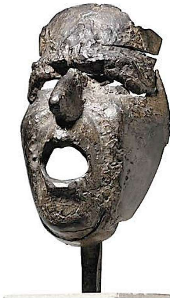
Juli González. Màscara de Montserrat cridant (1939). Bronze fos, 32,8 × 14,9 × 12 cm.

Observeu la imatge següent. Fixeu-vos també en l'any i el títol.