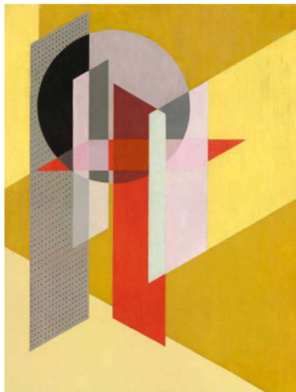
László Moholy-Nagy. Z VII (1926). Pintura a l'oli de la sèrie «Z».