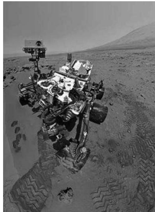
Imatge del Curiosity al cràter Gale, a la superfície de Mart (31 d'octubre de 2012)

DADES: Massa de Mart, M_{\text{Mart}} = 6,42 \times 10^{23}\text{ kg} . Radi de Mart, R_{\text{Mart}} = 3,39 \times 10^6\text{ m} . G = 6,67 \times 10^{-11}\text{ N m}^2\text{ kg}^{-2} .