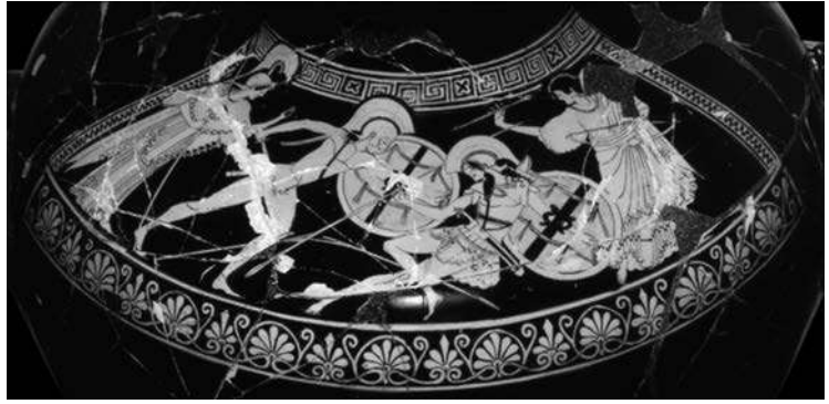
Ceràmica de figures vermelles (500-450 aC), Museu Gregorià Etrusc del Vaticà (Roma)

Aquesta imatge mostra la mort d'Hèctor. Feu una redacció (entre cent cinquanta i dues-centes paraules) en què expliqueu com es produeix aquest fet segons la narració de la Iliada . El vostre text ha de donar resposta a les preguntes següents: