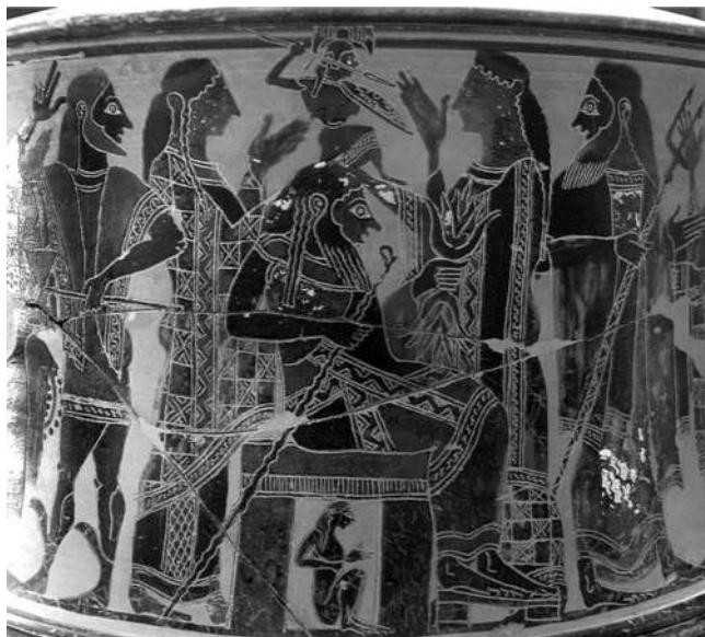
Trípode de figures negres (ca. 570-560 aC), Museu del Louvre (París)