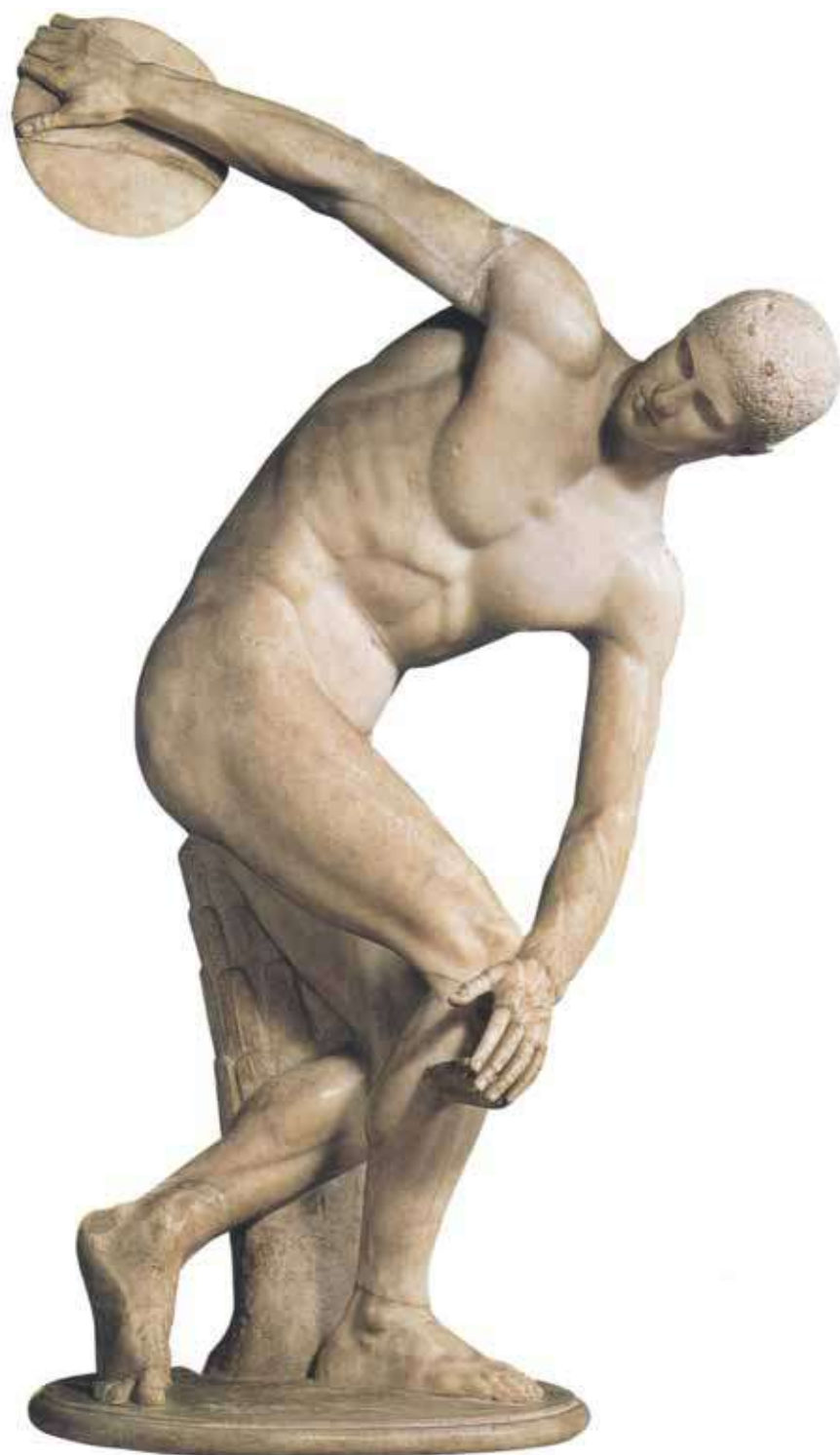
OBRA 2. Discòbol , de Miró.