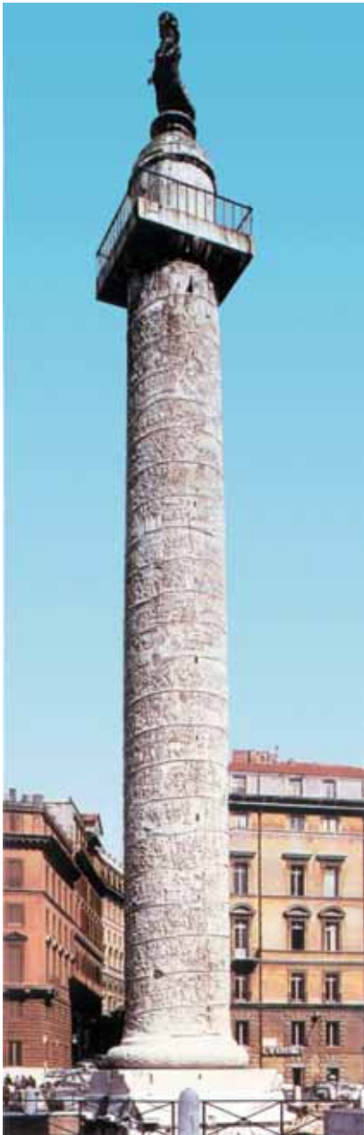
OBRA 2. Columna Trajana.