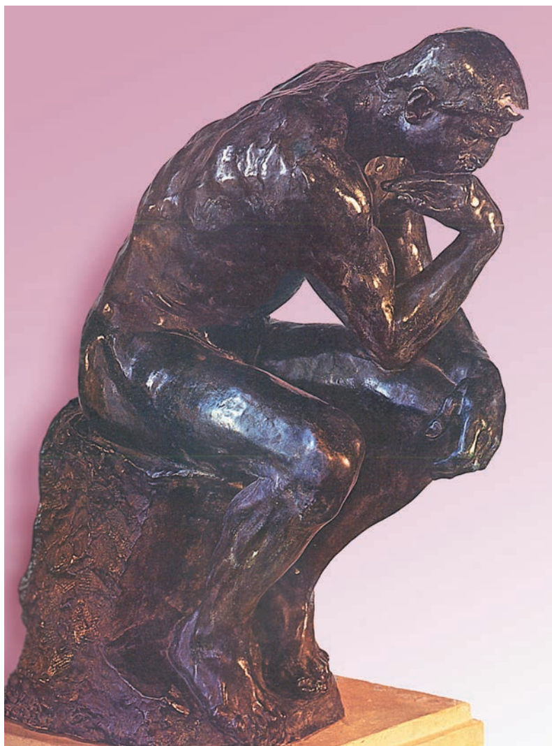
El pensador , de François-Auguste Rodin