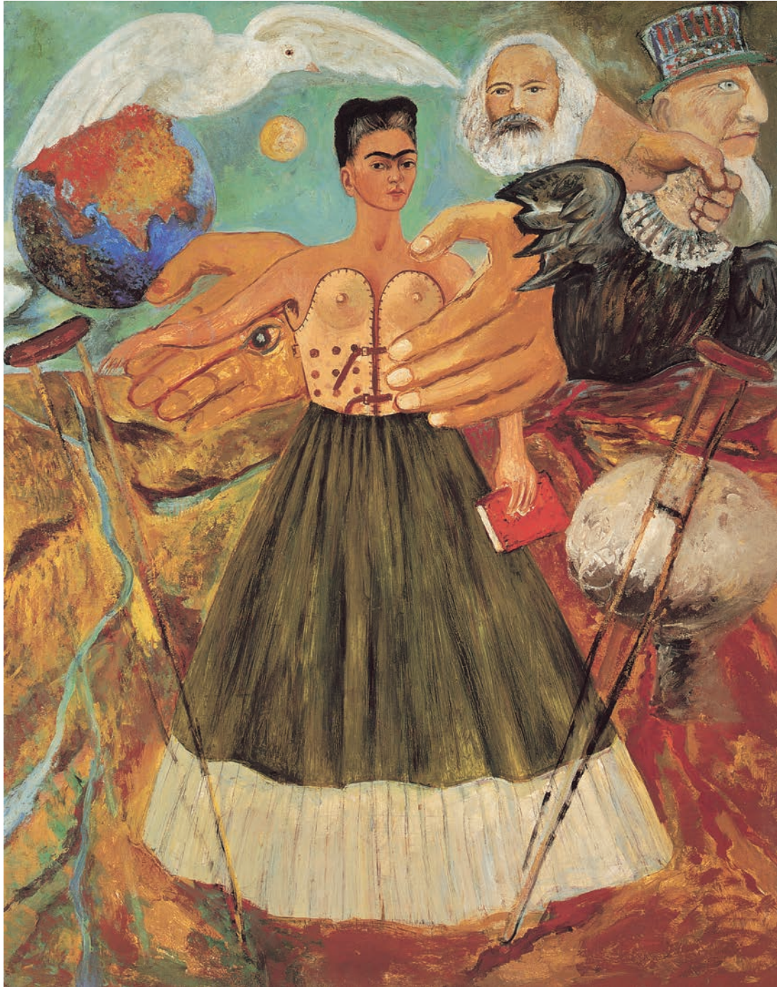
El marxisme sanarà els malalts , de Frida Kahlo