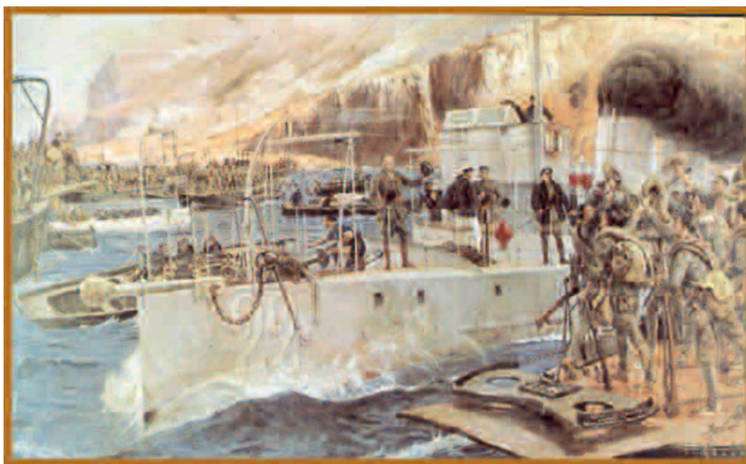
FONT: José MORENO CARBONERO. El desembarco de Alhucemas (oli, 1927).