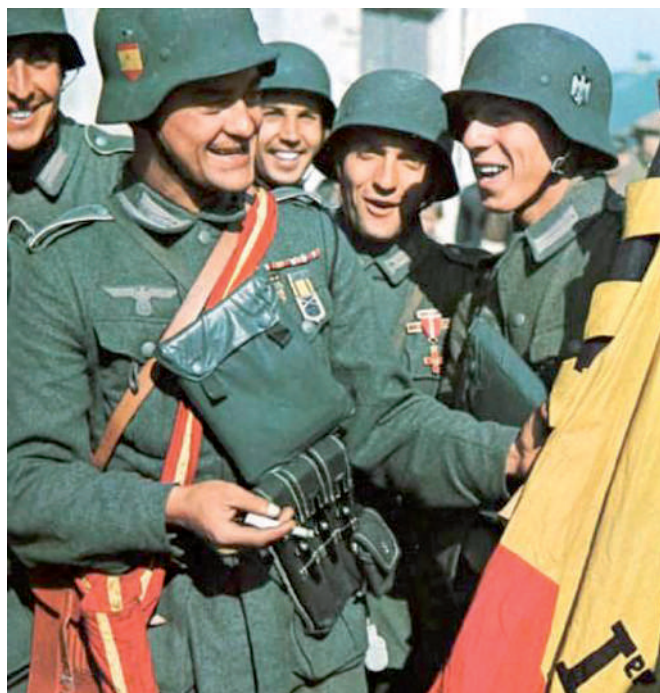
FONT: División Azul , 1941.