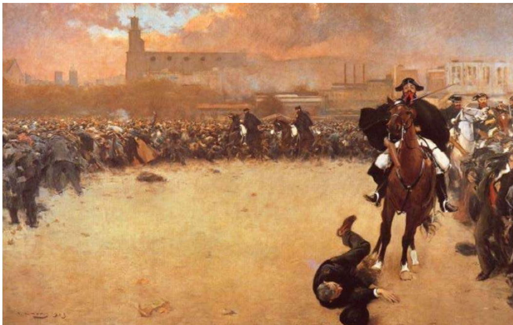
La càrrega o Barcelona 1902

FONT: Ramon Casas, 1899 (Museu de la Garrotxa, Olot).