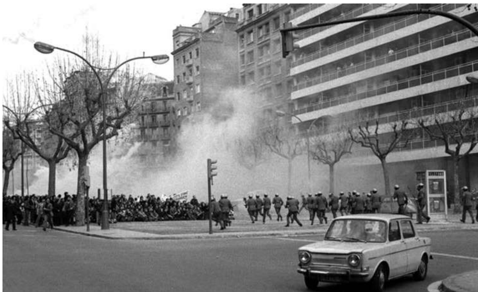
Manifestació proamnistia a Barcelona. FONT: Manel Armengol, 1976.