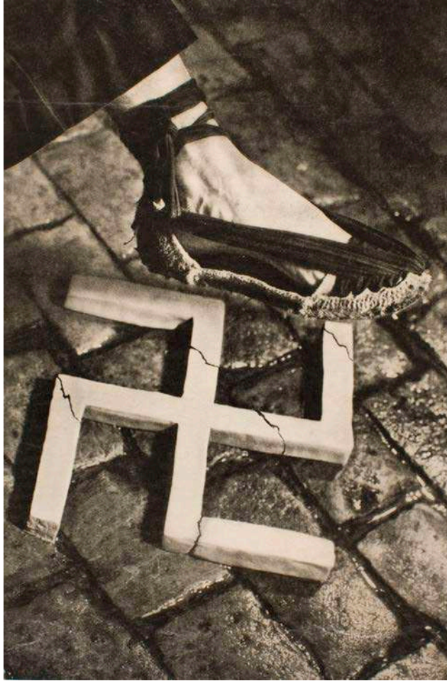
FONT: Pere Català Pic, «Aixafem el feixisme», 1937.