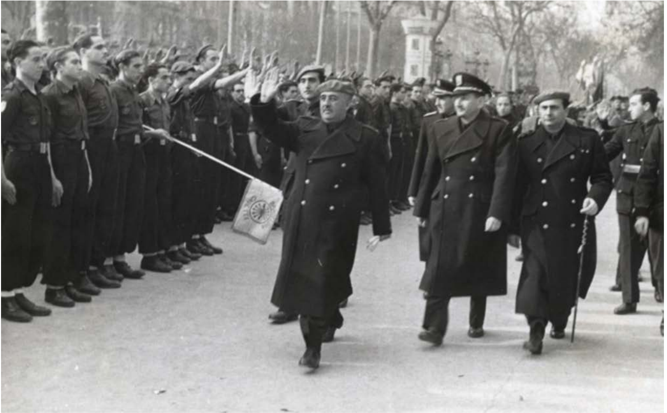
Visita de Franco a Barcelona, 30 de gener de 1942.