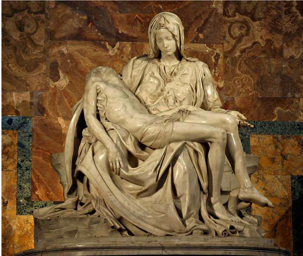
Pietat , de Miquel Àngel

a) Dateu l'obra i situeu-la en el context històric i cultural corresponent.