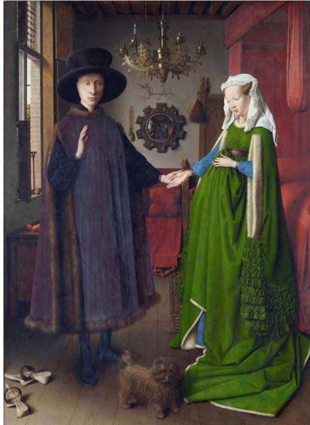
El matrimoni Arnolfini , de Jan van Eyck

a) Dateu l'obra i situeu-la en el context històric i cultural corresponent.