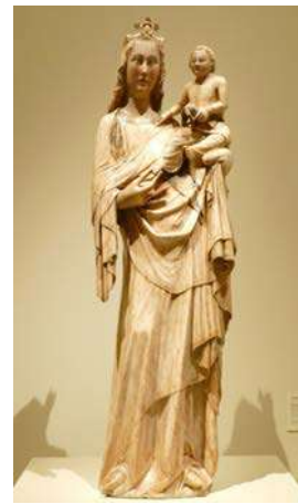
Maredeu de Sallent de Sanüija (ca. 1350, Barcelona, MNAC)