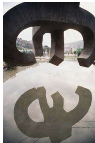
Elogi de l'aigua , d'Eduardo Chillida