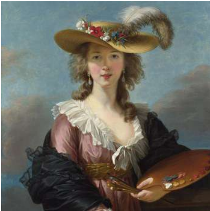
Autoretrat , d'Élisabeth Vigée Le Brun, 1782 (Londres, Galeria Nacional)