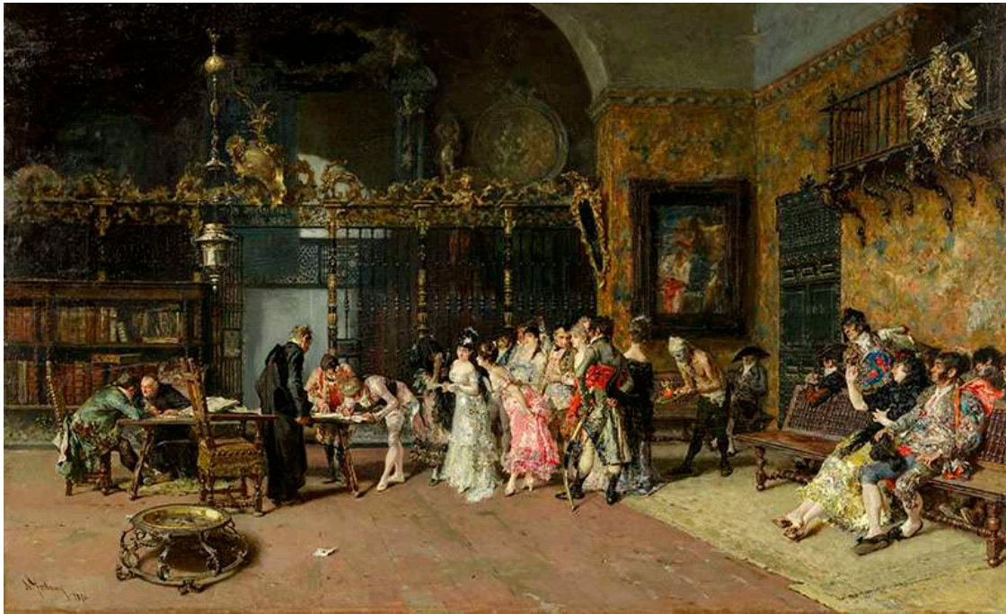
La vicaria , de Marià Fortuny