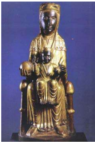
Maredeu de Montserrat (ca. 1200, Montserrat, Basílica)

e) Enumereu quatre diferències o semblances entre les dues escultures següents, representatives del romànic i del gòtic, respectivament.