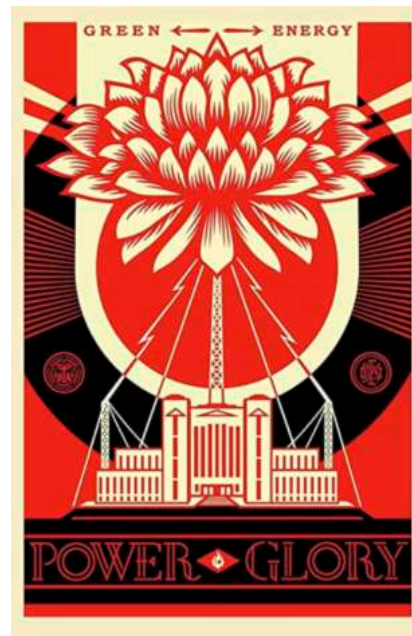
IMATGE C. Green Power , Shepard Fairey ( Obey ), litografia òfset, 2019