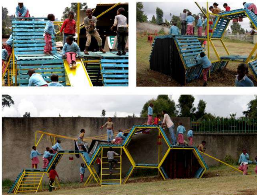
IMATGE E. Autoparc La casa dels nens perduts, Addis Abeba (2012)

Basurama és un col·lectiu fundat el 2001 que centra les seves actuacions en les possibilitats creatives que ofereixen els residus que generem. Per exemple, a l'orfenat governamental Kibebé Tsehay, que es troba a Addis Abeba (Etiòpia), hi havia un pati molt gran sense ombra i Basurama hi va construir una zona de jocs fent servir palets de fusta, tal com podeu veure en la imatge E.