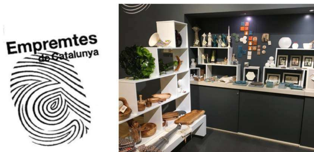
IMATGE A. Logotip i botiga de la marca Empremtes de Catalunya

Empremtes de Catalunya (imatge A) és una marca registrada d'artesanía que identifica i distingeix productes artesans fets a diferents zones de Catalunya. Els productes que selecciona transmeten els valors tradicionals del país i són d'una alta qualitat artesana, i, a més a més, són contemporanis i presenten una imatge que es correspon amb l'actualitat cultural.