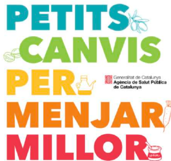
IMATGE G. Cartell de la campanya «Petits canvis per menjar millor»

Trieu dues d'aquestes idees i dissenyeu dos adhesius de 10 × 10 cm. Cal que el missatge sigui comprensible i resumeixi amb claredat el concepte que heu escollit. Cal deixar només allò que és essencial perquè el missatge sigui llegible a distància. És important que mantingueu la coherència gràfica amb el cartell de la campanya (imatge G) i entre els dos adhesius, de manera que creu una família visual.