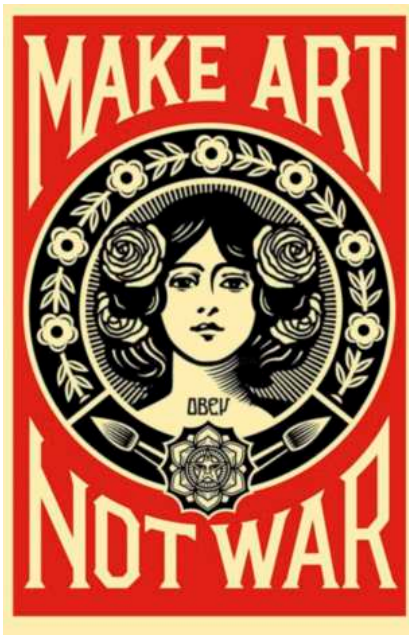
IMATGE B. Make Art Not War , Shepard Fairey ( Obey ), art digital, 2016

L'ús i la disposició de les formes, les línies i els colors, així com la composició visual d'aquests elements, són el que caracteritza la seva obra creativa. Observeu dos exemples de les seves il·lustracions en les imatges B i C: