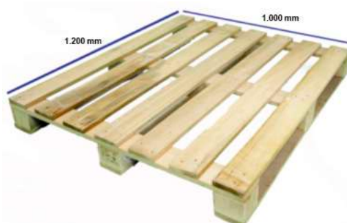
IMATGE F. Palet de fusta industrial

Inspirant-vos en aquesta proposta, dissenyeu un espai de lectura per al pati del vostre institut. Cal que disposi de seients amb una coberta que proporcioni ombra, i ha de ser elaborat amb palets de fusta industrials (imatge F).