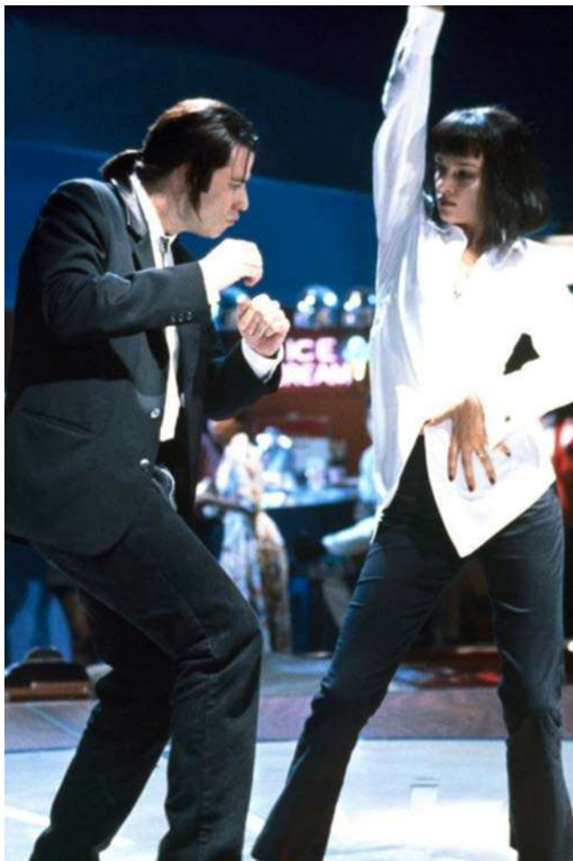
Fotograma de Pulp Fiction (1994), de Quentin Tarantino.

Observeu atentament el fotograma següent de la pel·lícula Pulp Fiction (1994), de Quentin Tarantino, i responeu a les qüestions 2.1, 2.2 i 2.3.