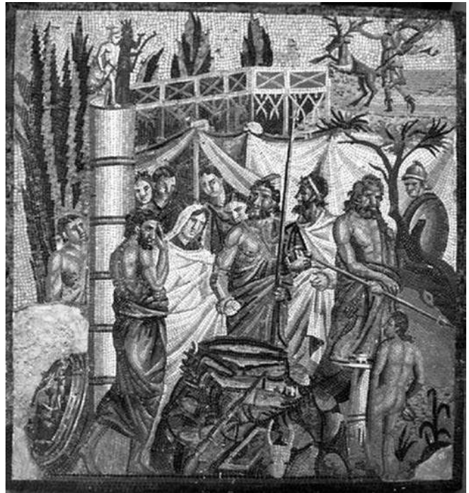
Museu d'Arqueologia de Catalunya (Empúries)

— Com serà el retorn d'Agamèmnon a casa?