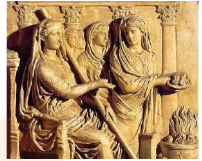
Vestals alimentant el foc sagrat