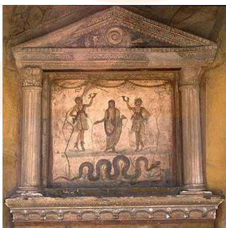
Lararium de la casa dels Vetti, Pompeia