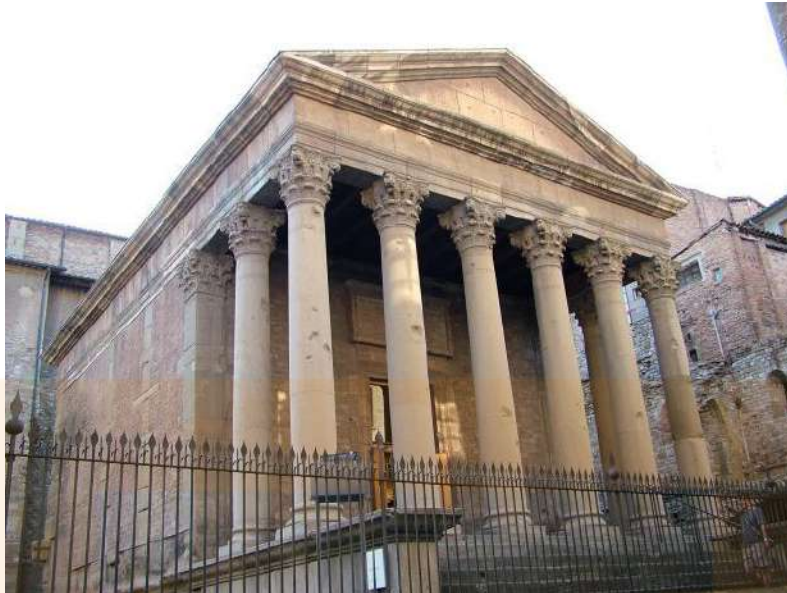
Temple romà de Vic.