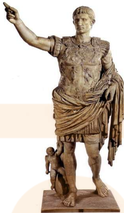
August de Prima Porta