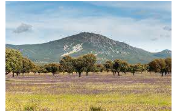
Els Monts de Toledo

- Els Monts de Toledo: divideixen en dues parts la Submeseta Sud: Són la divisòria d'aigües entre la Conca del Tajo i la del Guadiana. Són un conjunt de serralades d'alçades modestes: Els Monts de Toledo o les Serres de Guadalupe.