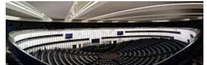
Tribunal de Justícia (Luxemburg)

SELECTIVITAT ONLINE Centre d'estudis Progressa