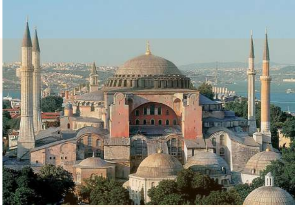
Santa Sofia de Constantinoble (532-537), actual Istanbul (Turquia)