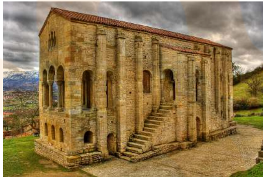
Anònim. Santa María del Naranco (842-850). Oviedo. Primerament fou un palau reial i posteriorment convertit en església, d'aquí que no segueixi la tipologia d'església. Santa María del Naranco és un dels exemples d'art mossàrab.