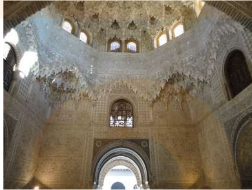
Anònim. Detall de la cúpula de la sala dels Abenserrais a l'Alhambra ( s.XIV), Granada. En ella s'hi pot apreciar l'aplicació de l'horror vacui on no queden espais sense decorar.