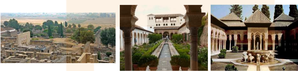
1. Ruïnes del palau de Medina Al-Zahara (936) 2. Palau del Generalife (s.XIV) on hi observem el jardí amb l'aigua. 3. Pati dels lleons (s.XIV), Alhambra, Granada.