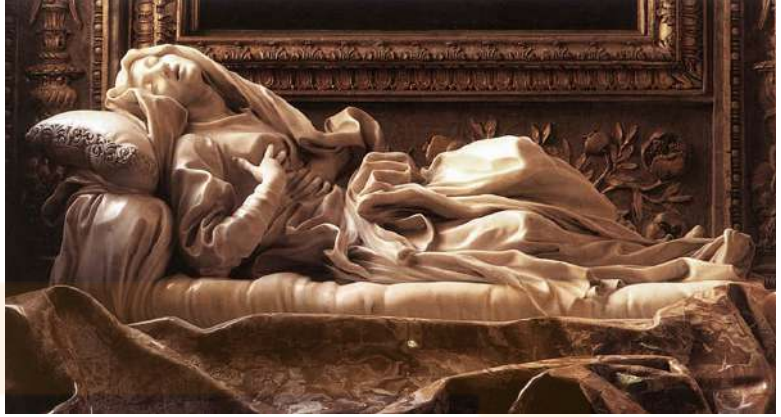
Una de les onze escultures amb àngels portant atributs de la Passió de Crist al pont de Sant'Angelo, Roma. Bernini. Àngel amb sudari (1668). A la dreta, Bernini. Beata Ludovica Albertoni (1671-1675), església de San Francesco a Ripa, Roma.