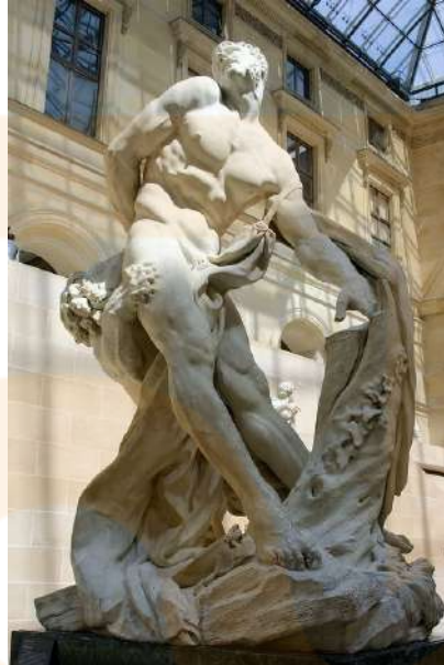
Girardon. Apol·lo i les nimfes de Tetis ( 1666-1673), marbre. Gruta de Tetis, Palau de Versalles, Paris. A la dreta, Puget. Miló de Crotona (1682), marbre. Musée du Louvre, Paris.