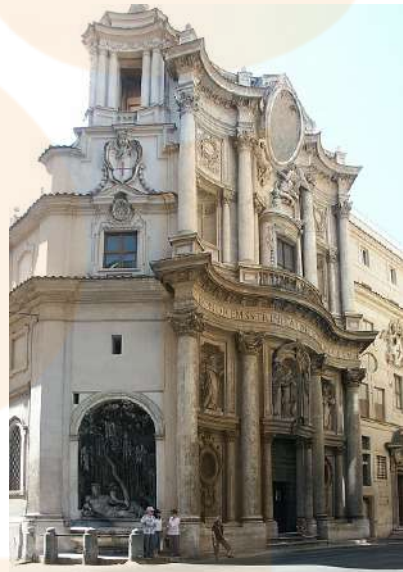
A la dreta, Bernini, Columnata de la Plaça de Sant Pere del Vaticà (1656). A la dreta, Borromini. Façana de San Carlo alle Quattro Fontane (1665-1667), Roma.