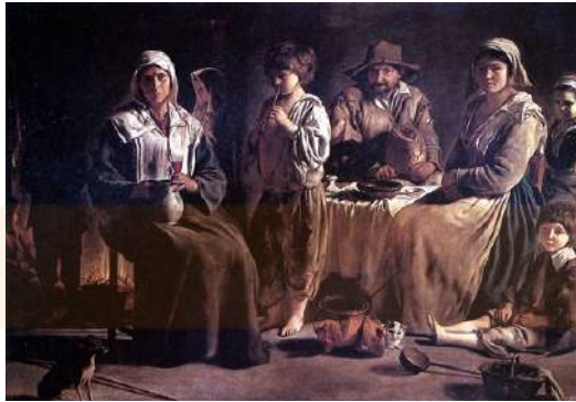
Louis. Le Nain,. Família de pagesos (1642), oli sobre tela, Musée du Louvre, Paris.