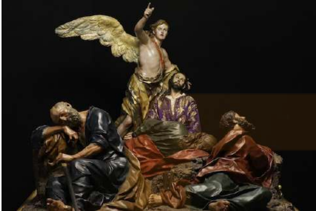
Gregorio Fernández, Crist Jacent (1614), fusta policromada. Museo Nacionalde Escultura, Valladolid. Francisco Salzillo. Oració a l'Hort (1752), Museo Salzillo, Múrcia.