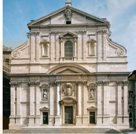
A la dreta Maderno. Façana de Sant Pere del Vaticà (1607-1612). A la dreta Della Porta. Façana de l'església del Gesù (1575-1577), Roma.