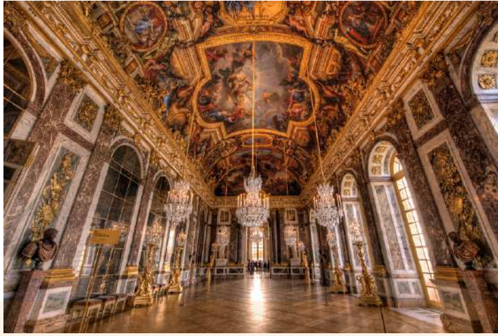
Hardouin-Mansart. Saló dels miralls (1678-1686). Palau de Versalles ( França)