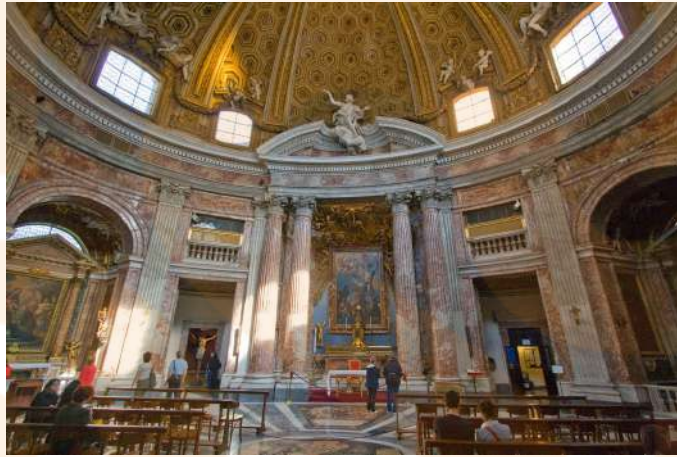
Bernini. Vista interior de Sant'Andrea al Quirinale (1658-1670), Roma.

En ella hi apreciem l'art barroc com un art total, en el que arquitectura, pintura i escultura es troben integrats en l'obra.