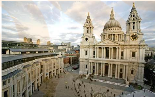
Christopher Wren. Catedral de Saint Paul (1675-1710), Londres.

En quant al nord d'Europa, està marcat encara per l'estil classicista tot i la introducció d'alguns elements decoratius que portarien més endavant al rocó.