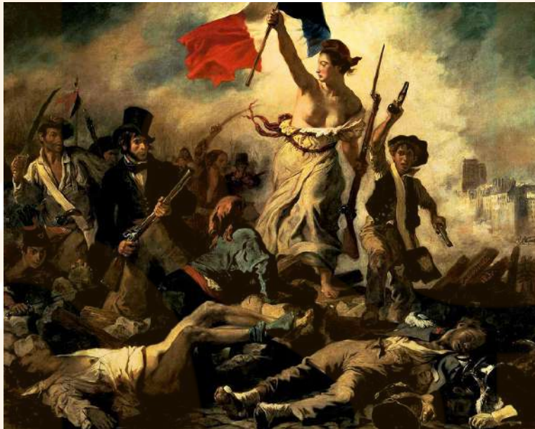
Delacroix. Llibertat guiant al poble (1830), oli sobre tela. Musée du Louvre, Paris.