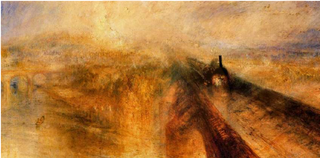
Turner. Pluja, vapor i velocitat (1844), oli sobre tela. National Gallery of Art, Londres. L'ambient plujós i de vapor plasma l'ambient característic de la pintura romàntica alhora que és una antecedent de l'impressionisme.

La pintura romàntica anglesa es va basar en la temàtica paisatgística on hi destaquen Turner i Constable. Els dos autors representaven les emocions que els produïen el contacte amb la natura, els paisatges...La manera en la que els captaren ( llum, atmosfera, color...) van iniciar el camí de l'impressionisme.