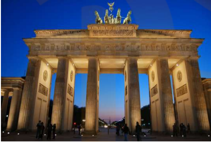
A la dreta Vignon. La Madelaine (1806-1842), Paris. A l'esquerra, Karl Gottard Langhans. Porta de Brandenburg (1788-1789), Berlín.