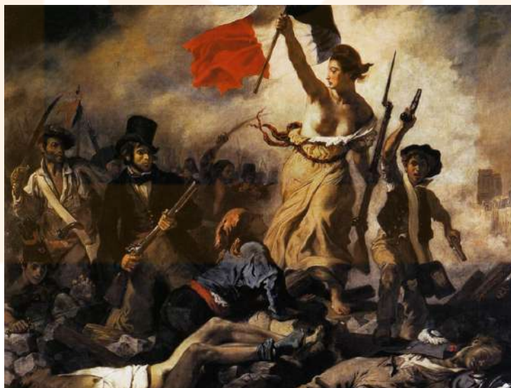
Delacroix. Llibertat guiant al poble (1830), oli sobre tela. Musée du Louvre, París. " Ja que no he lluitat per la pàtria, almenys pintaré per ella" afirmà Delacroix.