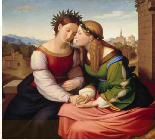
A l'esquerra, Friedrich. Viatger davant del mar de boira (1818), oli sobre tela. Kunsthalle Hamburg ( Alemanya). A la dreta, Overbeck, Itàlia i Alemanya (1811-1829), oli sobre tela. Kunstareal, Munic.