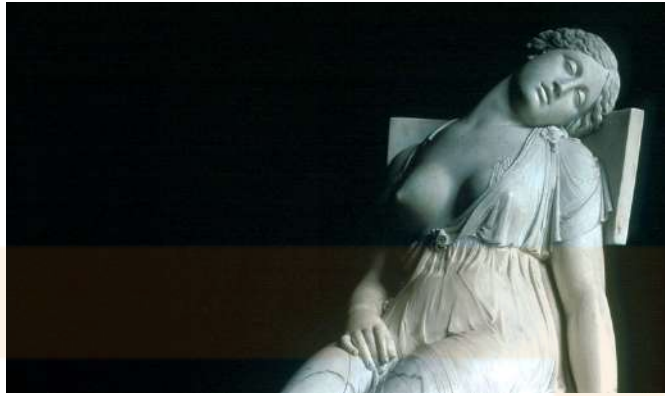
A l'esquerra, Thordvalsen. Jàson amb el velló d'or (1803), Museu Thorvaldsen, Copenhaguen. A la dreta, Campeny. Lucrècia (1804), marbre. Reial Llotja de Comerç, Barcelona.