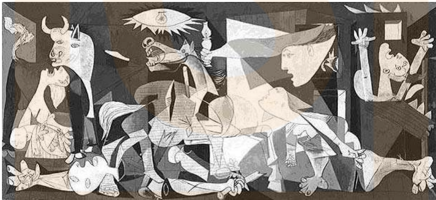
Picasso. Guernica ( 1937), oli sobre tela. Museo Nacional Centro de Arte Reina Sofía, Madrid. El quadre, que representa el bombardeig del poble de Guernica ha passat a ser un dels símbols de la capacitat de destrucció que té l'home.