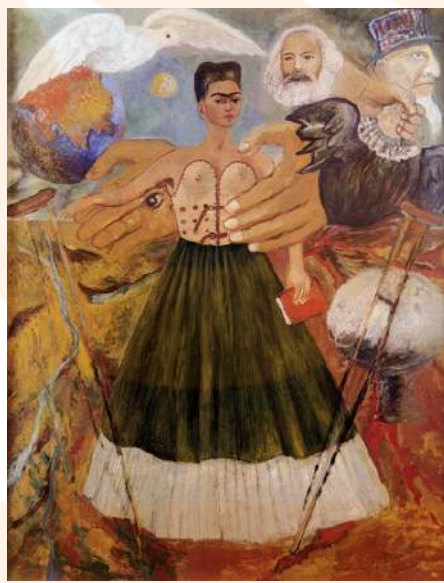
A l'esquerra, De Chirico. Misteri i melangia en el carrer (1914), oli sobre tela. Col·lecció particular. En l'obra s'aprecien les imatges inquietants i la distorsió de les lleis de la perspectiva. A la dreta, Frida Kahlo. El marxisme sanarà els malalts , 1954 oli sobre tela. Museo Frida Kahlo (Coyoacán, D.F. Mèxic).