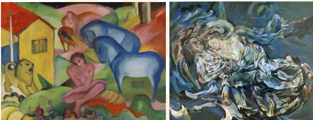
A l'esquerra, Marc. El somni (1912), oli sobre tela. Museo Thyssen-Bornemisza, Madrid. En ella s'hi veu la visió amable del grup expressionista "el Genet Blau". A la dreta, Kokoschka. L'esposa del vent (1914), Kunstmuseum, Basilea.