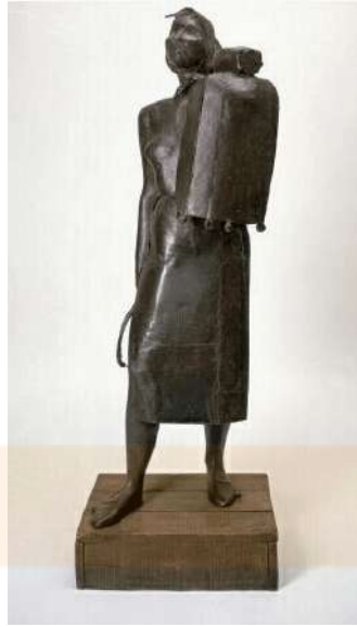
A la dreta, Gargallo. El profeta (1933), bronze. Museo Nacional Centro de Arte Reina Sofía, Madrid. A la dreta, Juli González. La Montserrat (1937), plantes de ferro soldat. Stedelijk Museum Amsterdam.