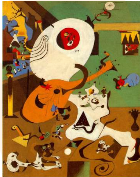
Miró. Interior holandès I (1928), oli sobre tela. Museum of Modern Art, Nova Yor. Miró creà un món particular a partir de la seva realitat amb símbols propis, colors vius i purs-