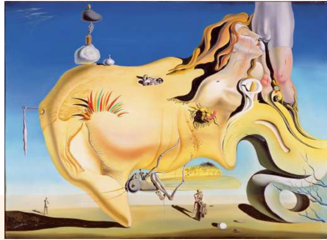
A l'esquerra, Magritte. La clau dels camps (1936), Museo Thyssen-Bornemisza, Madrid. A la dreta, Dalí, El gran masturbador (1925), oli sobre tela. Museo Nacional Centro de Arte Reina Sofía, Madrid.

Dins del grup surrealista destacaren com: