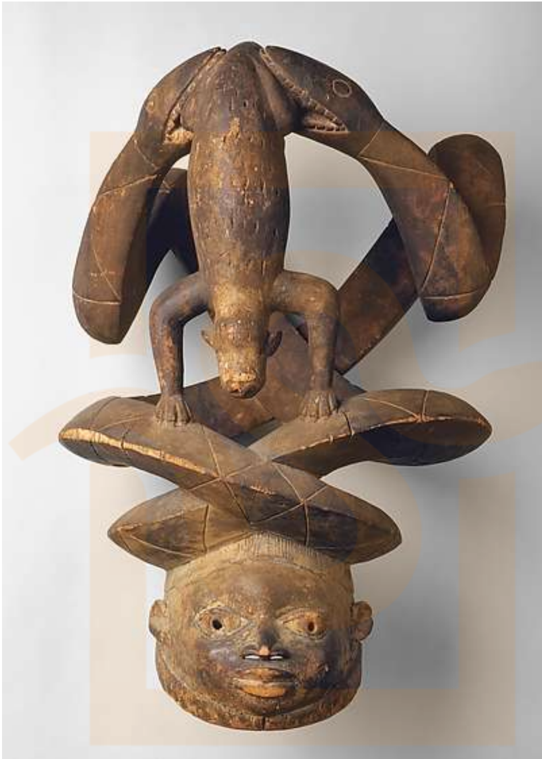
Figura 10: Màscara en forma de casc (Gelede), segle XX, Nigèria o República de Benín, poble ioruba, grup Ketu, fusta, 57,2 x 38,7 x 45,7 cm (El Museu Metropolità d'Art)