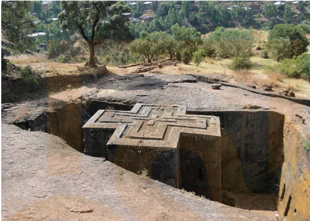
Figura 6: Església de Sant Jordi, Lalibela, Etiòpia.

La fe cristiana va inspirar les creacions artístiques de les dinasties posteriors, incloent-hi les extraordinàries esglésies de Lalibela procedents de roca sòlida a la XIII e segle, i els manuscrits il·luminats i altres arts litúrgiques de l'època salomònica posterior.