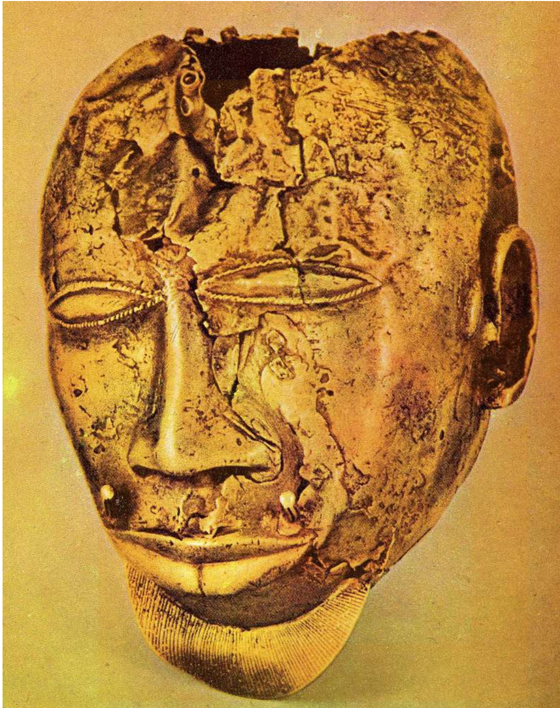
Figura II: Màscara d'or. Art aixanti.