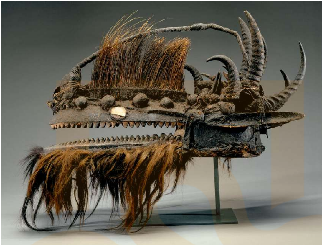
Figura 7: Casc, Mali; Pobles de Bamana (regió de Koulikoro)

boniques, maques o que agradin al gust general de la gent.