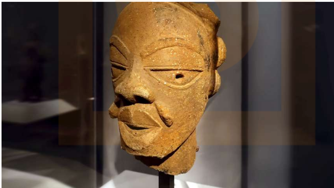
Figura 2: Escultura Nok, terracota.