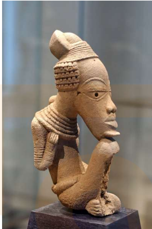
Figura 1: Escultura Nok, terracota.