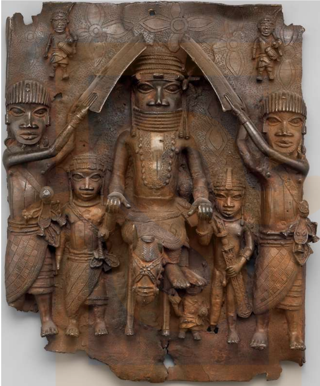
Figura 8: Oba eqüestre i assistents, 1550-1680, Nigèria, Tribunal de Benín, pobles Edo, llautó, 49,5 x 41,9 x 11,4 cm