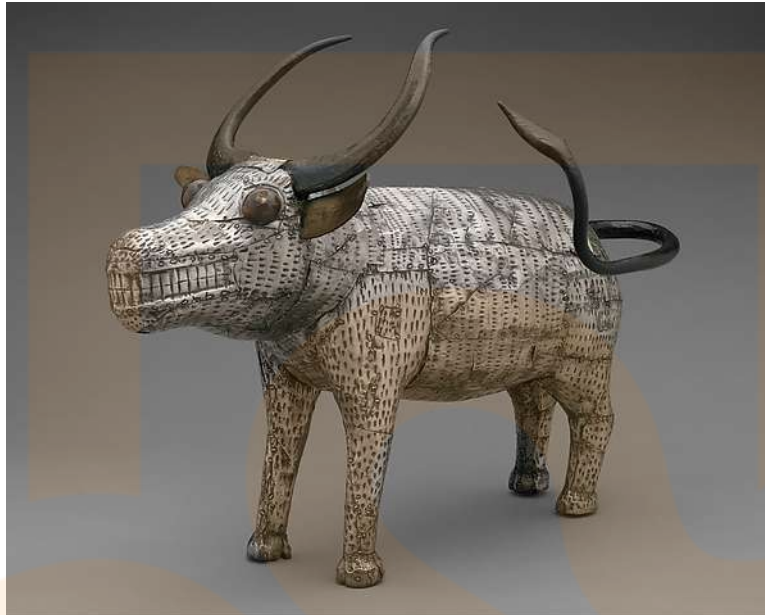
Figura 9: Buffalo (Bocio), segle XIX, República de Benín, poble de Fon, plata, ferro i fusta, 30,5 cm d'alçada (The Metropolitan Museum of Art)

Els animals amb atributs especials, com antílops, serps, lleopards i cocodrils, estan representats en l'art amb finalitats simbòliques. Les representacions d'animals que consumeixen altres animals poden servir com a metàfora de forces espirituals o socials que competeixen entre elles. La seva representació pretén fomentar altres mitjans menys destructius per resoldre una difícil trobada social.