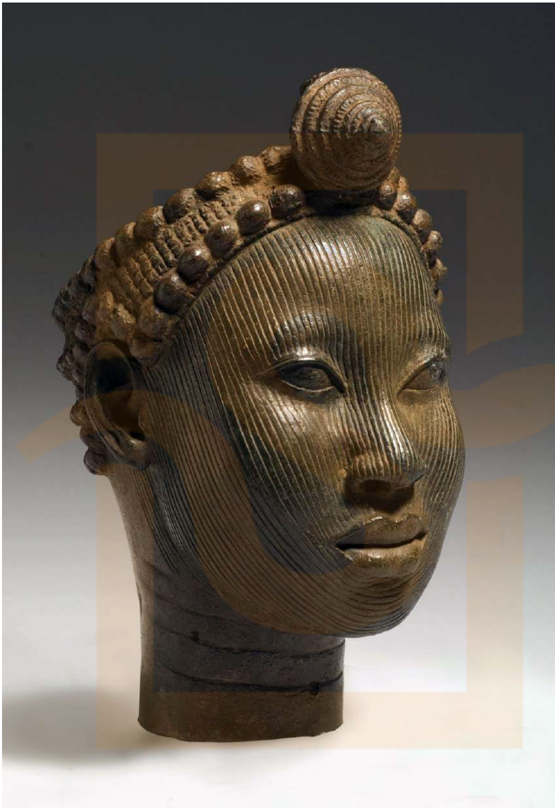
Figura 5: Escultura d'Ife.