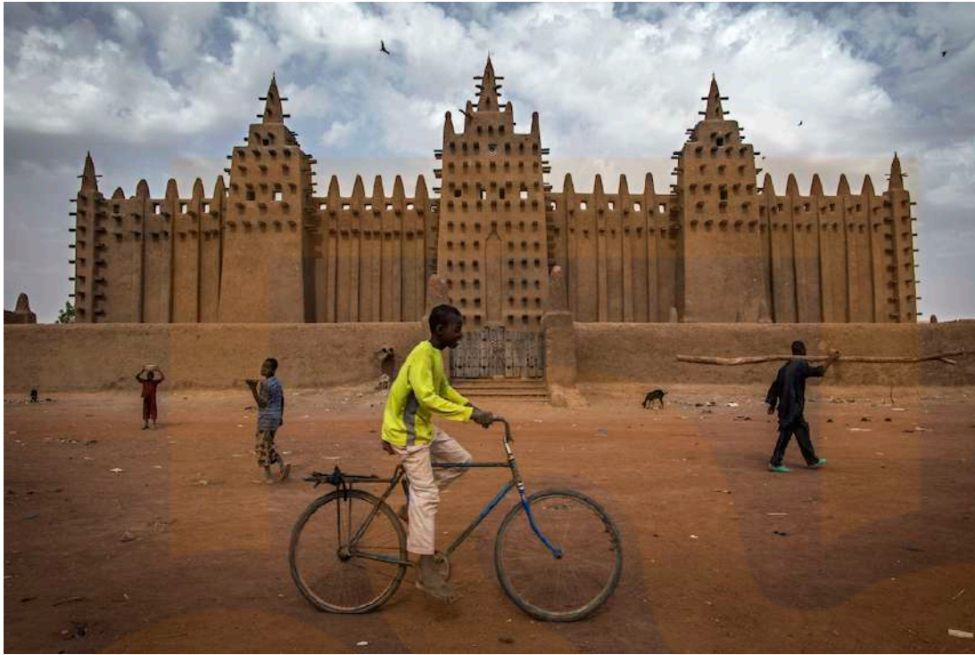
Figura 4: Una vista de la Gran Mesquita de Djenné, designada Patrimoni de la Humanitat per la UNESCO el 1988, juntament amb el nucli antic de Djenné, a la regió central de Mali.

XV i XVI, una de les més grans d'Àfrica, les ciutats de Timbuctu i Jenne (també conegudes com Djenne) van prosperar com a principals centres d'aprenentatge de la cultura i religió islàmica.