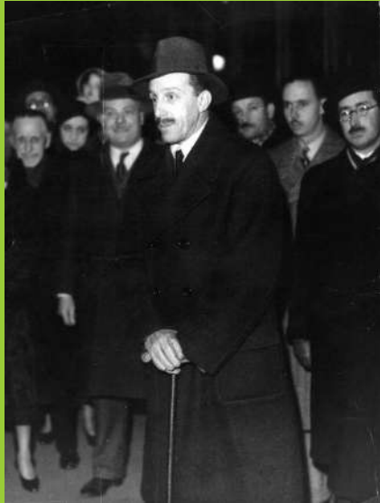
Fotografia d'Alfons XIII a Fontainebleau (França) l'any 1931

Alfons XIII va morir a l'exili a Roma el febrer de 1941.