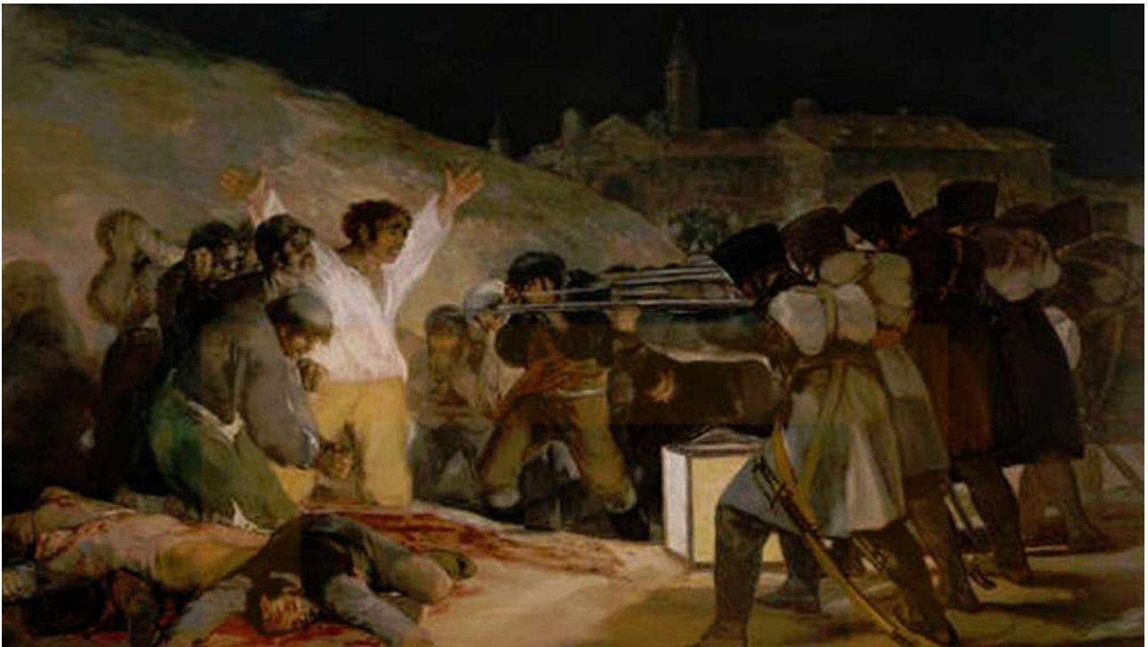
El tres de mayo, Goya. 1808

Goya va representar un xoc de corrents i va canviar la manera d'entendre la pintura respecte al poder. Argullol ho resumeix així: “ Va ser un pintor totalment lliure, el primer de la pintura europea ”. Després van venir altres artistes, com Delacroix, per evidenciar que la pintura pot existir fora del poder, que la pintura pot ser, també, del poble. I mentrestant, la Llibertat va començar a guiar-nos.