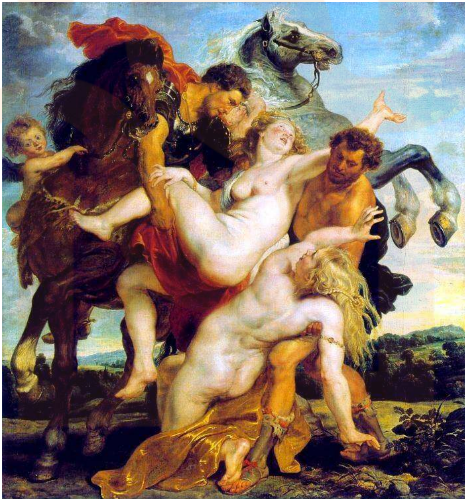
El rapte de les filles de Leucipo , Peter Paul Rubens, 1616.

Entre alguns dels temes presents en aquest moviment i que estan normalment exclosos en altres moviments d'art, com les funcions biològiques femenines o la maternitat. És per tant un art polític, que pretén ser fet per dones i sobre les dones i la seva situació social, tractant temes com el racisme, les condicions laborals o la violació.