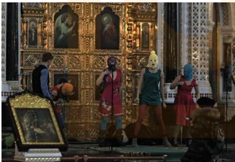
Performance: L'oració punk -¡Madre de Dios, echa a Putin!

Al febrer de 2012, cinc membres del grup punk rock feminista Pussy Riot van muntar una representació a la Catedral del Crist Salvador de Moscou per protestar contra el suport de l'església a Vladímir Putin durant les seves eleccions. El col·lectiu, vestit amb minifaldilles i passamuntanyes de colors cridaners, va ballar desenfrenat al crit de "¡Mare de Déu, Mare de Déu Divina, fes fora Putin!" Després de 40 segons, la Policia les va desallotjar. A continuació, tres de les membres del grup van ser condemnades a presó.