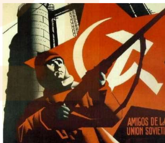
Alacant estalinista https://www.elmundo.es/