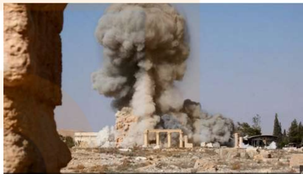
Imatge difosa per l'Estat Islàmic en la qual es pot veure el moment en què explota el temple de Baal, a Palmira