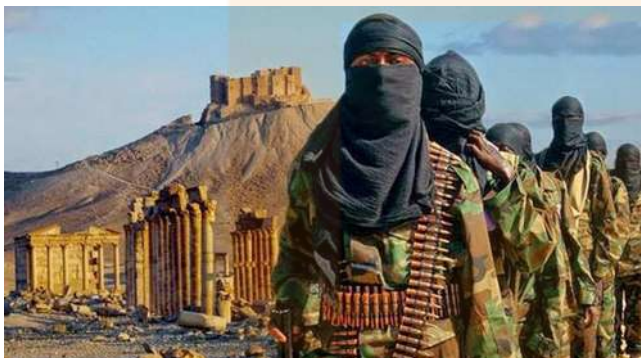
Terroristes de ISIS a Palmira

Imatges publicades a l'article: Lo que hay detrás de los ataques de ISIS al patrimonio cultural . La Vanguardia. David Ruiz Marull. 24/08/2018 00:15