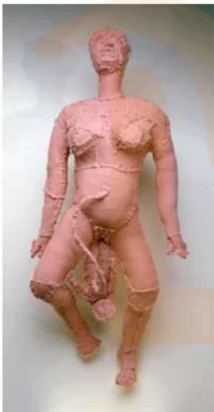
Louise Bourgeois, Arched Figure, 1999

Els mitjans són diversos, des dels mitjans més tradicionals, les performances a les arts menors com el brodat, teles, paper retallat o el patchwork, fins als canals més innovadors. La dona ha trobat en l'art un mitjà per a amplificar la seva denúncia.