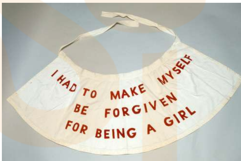
Vestimenta de la performance, She Lost It . Delantal amb text cosit. 1992

Impulsada per una aguda psicologia poc comuna, Louise Bourgeois (1911-2010), mai va deixar de tractar els temes universals: les relacions entre les persones, l'amor i la frustració entre amants o membres d'una família, l'erotisme... tot això amb malícia, ira o afecte. L'art, "garantia de salut mental", era el que li permetia de transformar els seus dimonis en aliats.