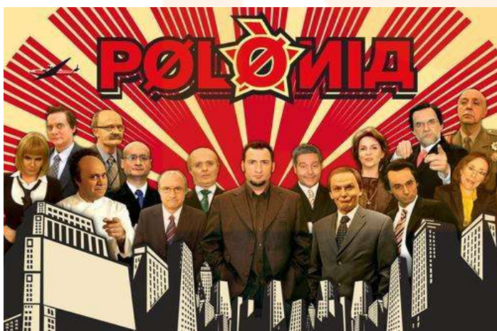
Caràtula del programa de TV3 Plònia https://www.domestika.org

Hi ha nombrosos exemples en que l'art dels cartells de propaganda política ha servit d'inspiració en produccions contemporànies.