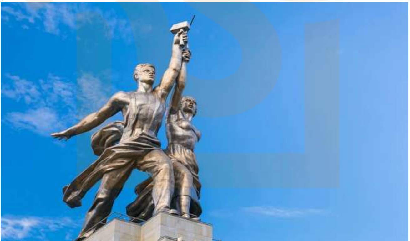
Rabochiy i Kolkhoznitsa , Vera Mukhina, 1937. Escultura Monumental en acer inoxidable, 26 metres d'alçada.

Jordi Garrido, 19 de maig de 2015. Revista Mirall