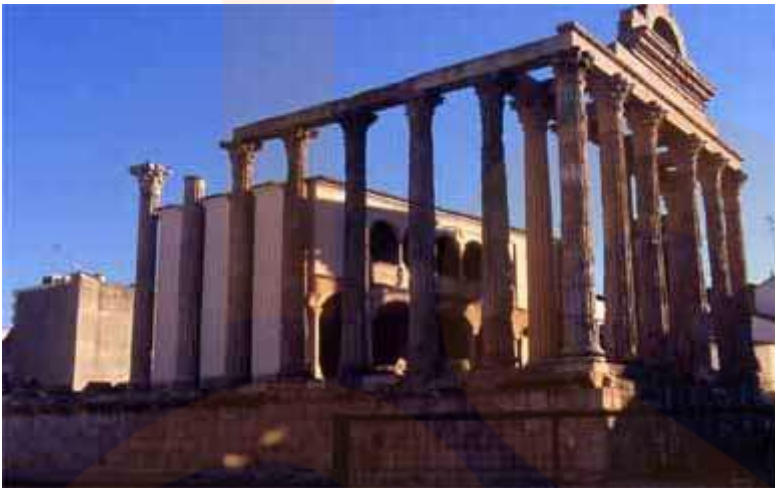
Restes del temple erròniament anomenat de Diana i en realitat dedicat al culte imperial, en el fòrum municipal