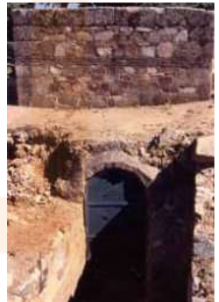
Castellum aquae de l'aqüeducte de San Lázaro

Més imatges en Simulacra Romae i Un paseo por Augusta Emerita