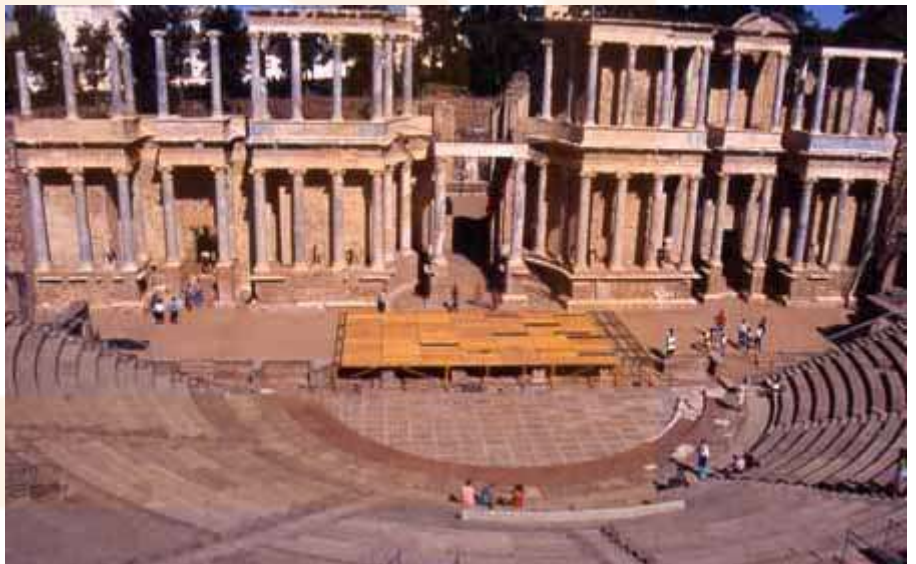
El frons scaenae del teatre, des d'un uomitorium i des de la cauea