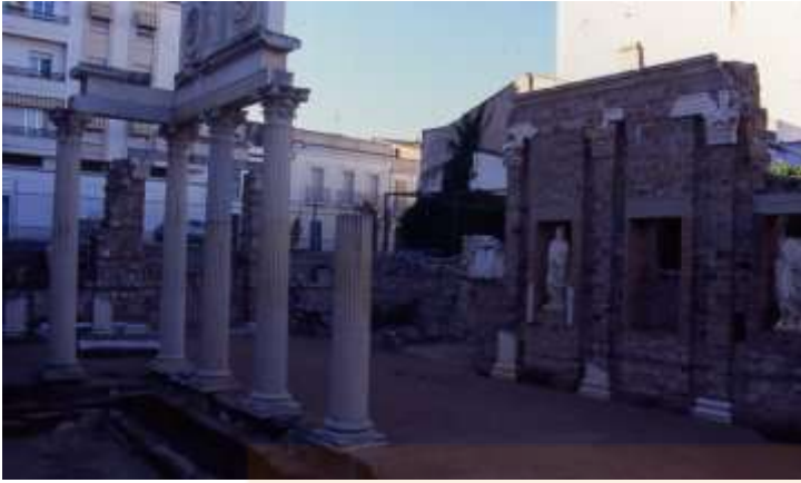
Restes del pòrtic del fòrum municipal