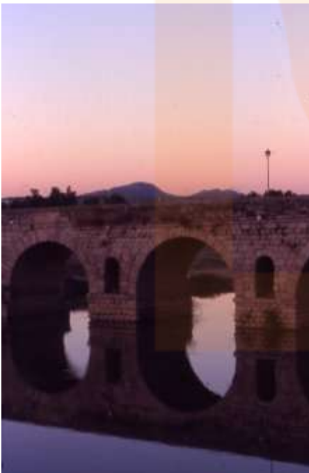
Detall del pont sobre el Guadiana