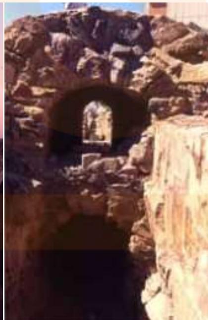
Aqüeducte de San Lázaro