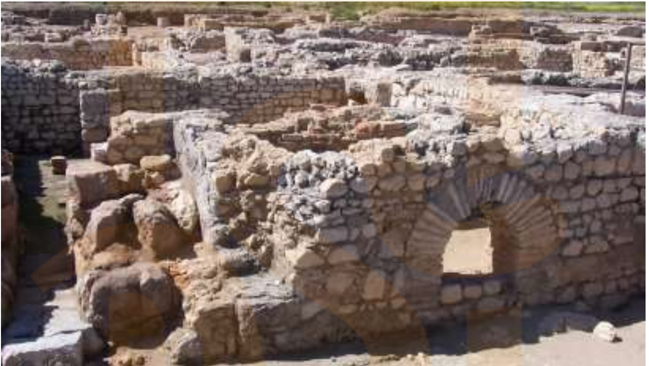
El praeefurnium (forn) de les termes