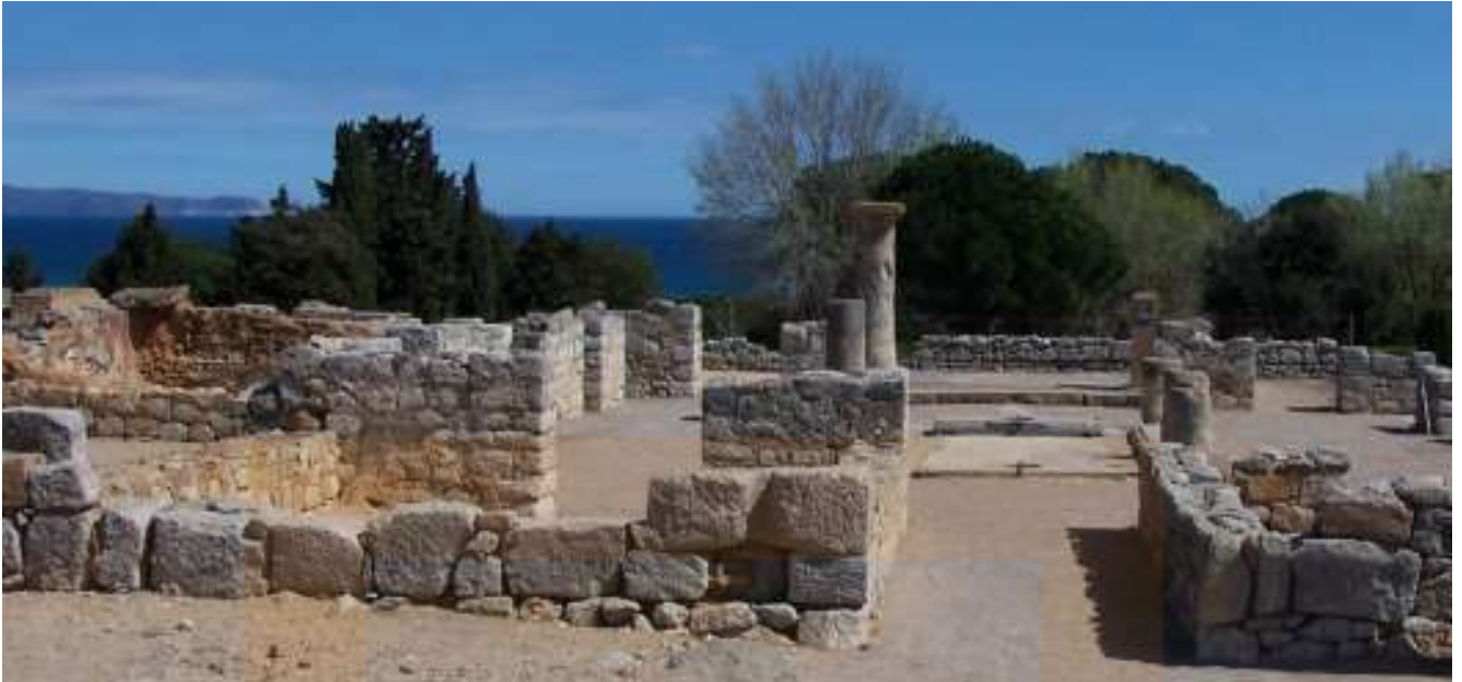
Entrada i atri de la domus 1

Més imatges en la pàgina web del Museu d'Arqueologia de Catalunya / Empúries