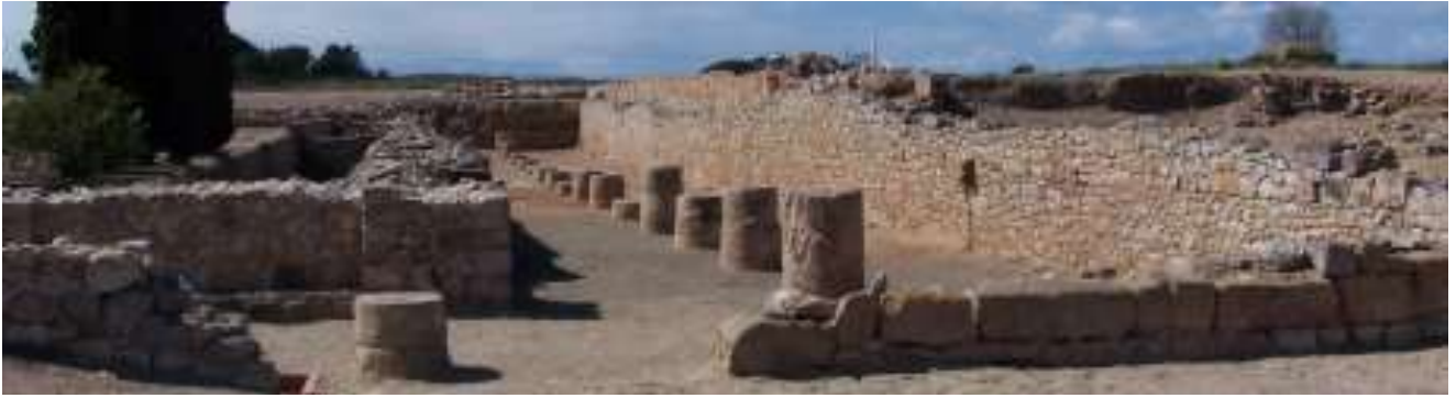
Restes del criptopòrtic que envoltava el temple del fòrum