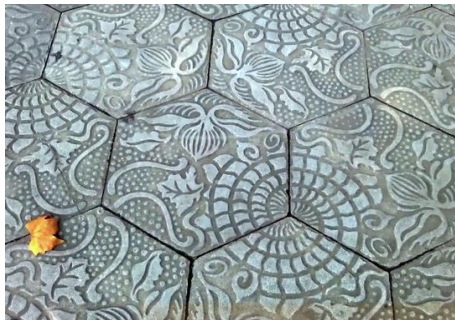
Panot, Antoni Gaudí