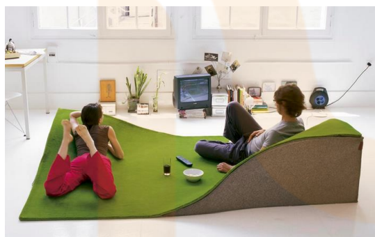
Catifa Flying carpet, Ana Mir/Emili Padrós

La difusió de l’obra dels dissenyadors catalans es du a terme mitjançant la projecció internacional dels Premis Delta, la realització de diverses exposicions, convocatòries com l’Any del Disseny del 2003, la creació del Barcelona Centre de Disseny (BCD), la publicació de diverses revistes (De Diseño, On, Diseño Interior, Èben...), o el sorgiment de noves associacions i nous premis.