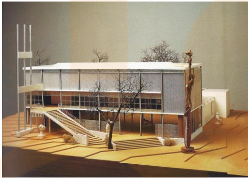
Maqueta Pavelló de la República Exposició Internacional París 1937, Josep Lluís Sert

Els dissenys del grup es van centrar en el mobiliari. El grau de modernitat i innovació van quedar palesos al Pavelló de la República de l'Exposició Universal de París de l'any 1937, on l'arquitectura, el disseny i les arts conviuen i assolien un destacat nivell global.