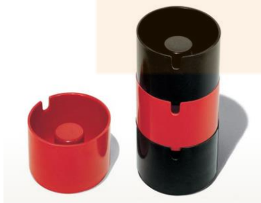
Cendrer Copenhaguen, André Ricard

Durant els anys cinquanta, mentre Europa es refeia de la Segona Guerra Mundial, alguns dissenyadors de Catalunya van iniciar contactes internacionals, com André Ricard, que va conèixer Raymond Loewy, dissenyador estrella de l'styling als Estats Units.