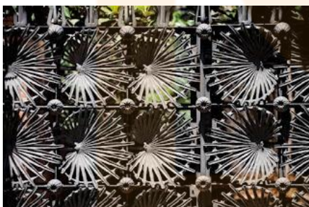
Forjat, Antoni Gaudí

Gaudí és un dels màxims exponents del període, i considerat un geni creador. A més dels seus edificis, els seus dissenys de mobiliari, bancs, cadires i panys per a portes són considerats una aportació genial a la cultura del disseny contemporani. Gaudí tractà els materials com la fusta, el ferro, els metalls o els materials ceràmics amb gran ductilitat, atorgant-los unes extraordinàries connotacions orgàniques no exemptes de característiques funcionals i econòmiques.