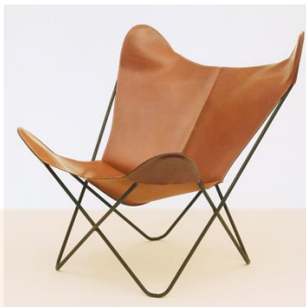
Cadira BFK, Antoni Bonet (grup Austral)