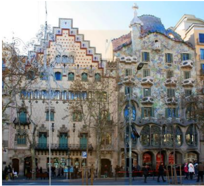
Casa Amatller, Josep Puig i Cadafalch

a l'últim detall determinen que els propis arquitectes s'encarreguin de dissenyar l'obra en la seva totalitat. Així ho van fer les personalitats del Modernisme com Lluís Domènech i Montaner, Antoni Maria de Gallissà, Josep Puig i Cadafalch i Antoni Gaudí i Cornet. Utilitzen els materials en estat natural i busquen sistemàticament la col·laboració amb els artesans.