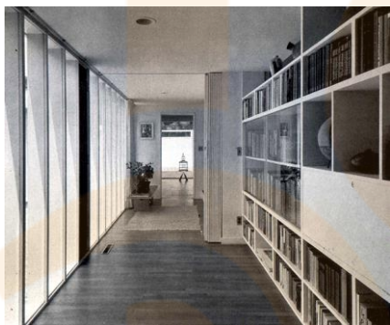
Casa Sert Cambridge, Josep Lluís Sert

Durant els anys cinquanta, mentre Europa es refeia de la Segona Guerra Mundial, alguns dissenyadors de Catalunya van iniciar contactes internacionals, com André Ricard, que va conèixer Raymond Loewy, dissenyador estrella de l'styling als Estats Units.