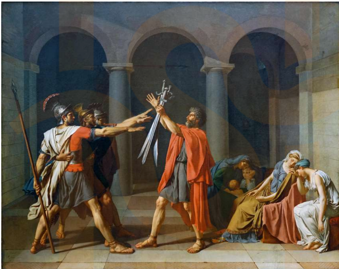
Figura 4: Jacques-Louis David, El jurament dels Horacis , 1784, oli sobre llenç, 3,3 x 4,25 m, pintat a Roma, exposat en el saló de 1785 ( Musée du Louvre , París)

En descriure les qualitats visuals, l'anàlisi formal generalment identifica certes característiques que contribueixen a la impressió general del treball. Per exemple, una forma lineal prominent podria suggerir força si és recta i vertical, gràcia o sensualitat si és sinuosa, o estabilitat i calma si és llarga i horitzontal. Els contrastos aguts en la llum i la foscor poden fer que una imatge se senti audaç i dramàtica, mentre que una il·luminació tènue pot suggerir suavitat o intimitat. En el passat, l'anàlisi formal suposava que hi havia algun nivell elemental d'universalitat en la resposta humana a la forma visual i tractava de descriure aquests efectes. Avui dia, el mètode s'entén com més subjectiu, però encara es valora com un exercici crític i un mitjà per analitzar l'experiència visual, especialment en els cursos introductoris d'història de l'art.