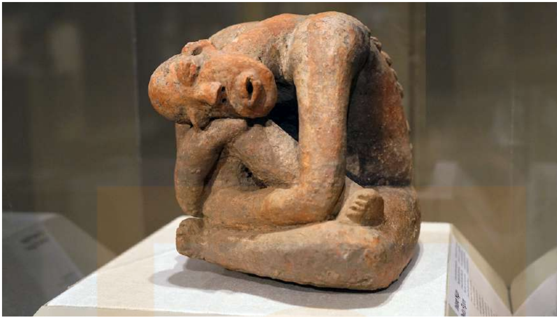
Figura 1: Figura asseguda, terracota, segle XIII, Mali, regió del Delta interior del Níger, pobles de Djenné, 25/4 x 29.9 cm (Museu Metropolità d'Art, Nova York)