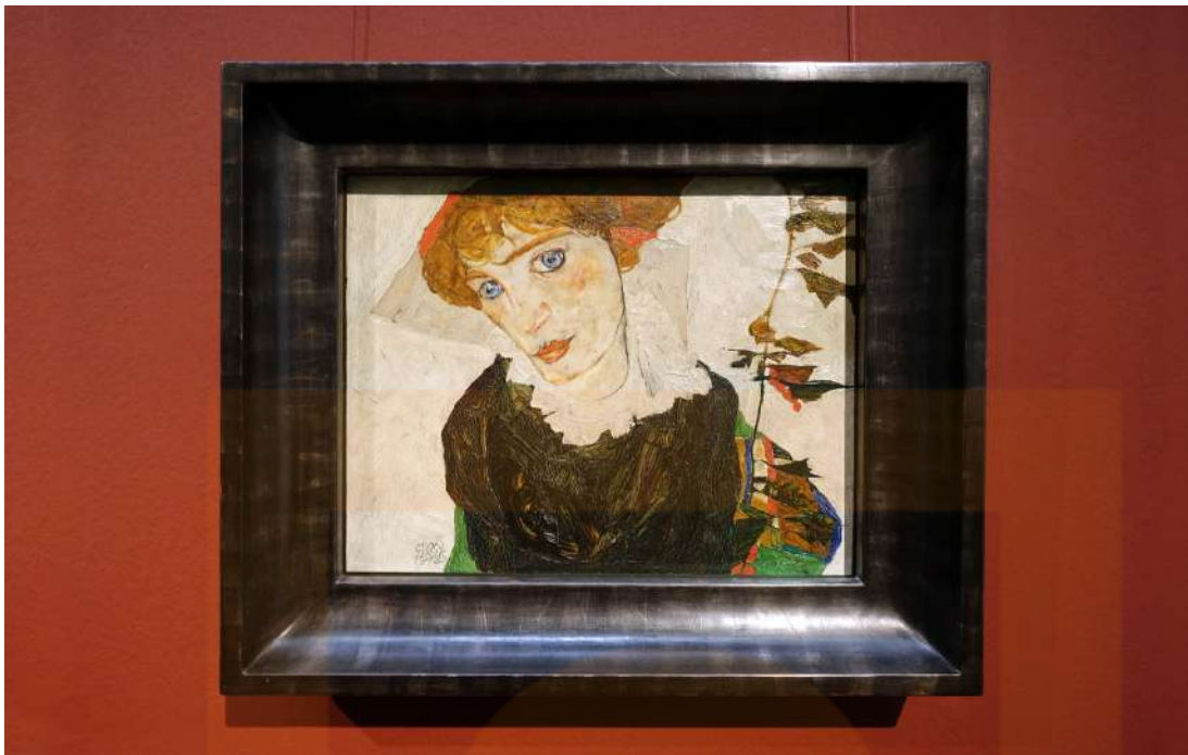
Figura 3: Egon Schiele, Retrat de Wally Neuzil , 1912, oli sobre taula, 32 × 39,8 cm (Museu Leopold , Viena)