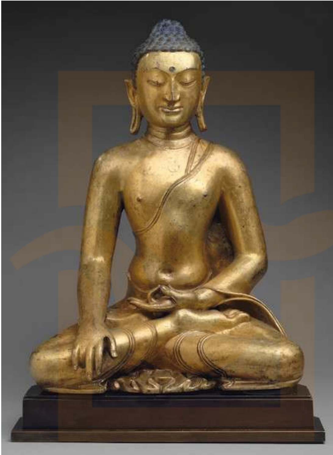
Figura 5: Buda Shakyamuni o Akshobhya , el Buda de l'Est, segles XI-XII, Tibet, coure daurat, 58 cm d'altura (Museu Metropolità d'Art, Nova York)