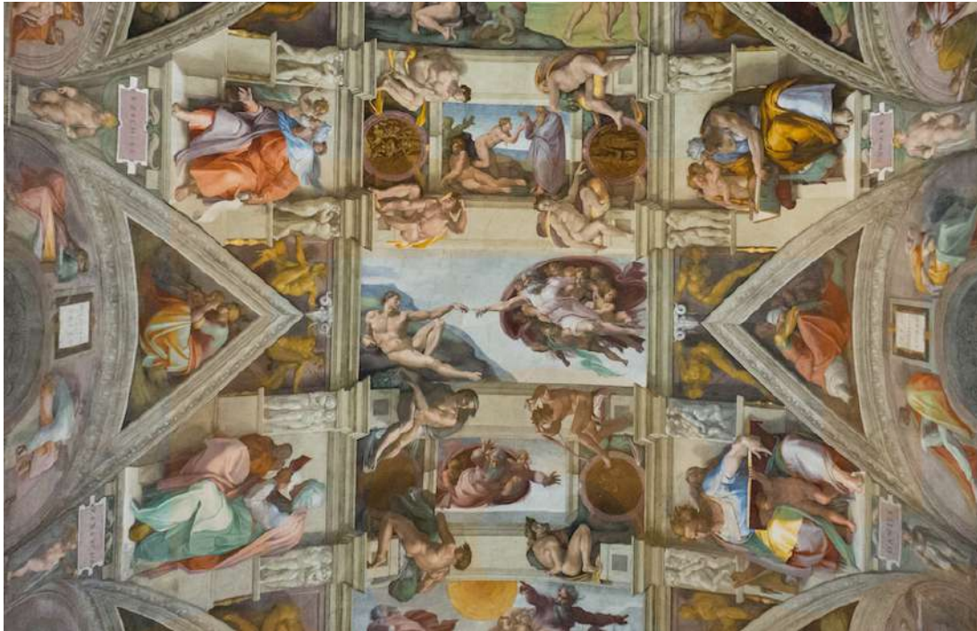
Figura 6: Miquel Àngel, volta de la Capella Sixtina (detall), 1508-12, Vaticà, Roma, foto: Kent G Becker (CC BY-NC-ND 2.0)

en nom del patró. Quan tals agents poden identificar-se, definitivament o hipotèticament, les seves motivacions es converteixen en contextos potencials per comprendre el propòsit i l'aparença.