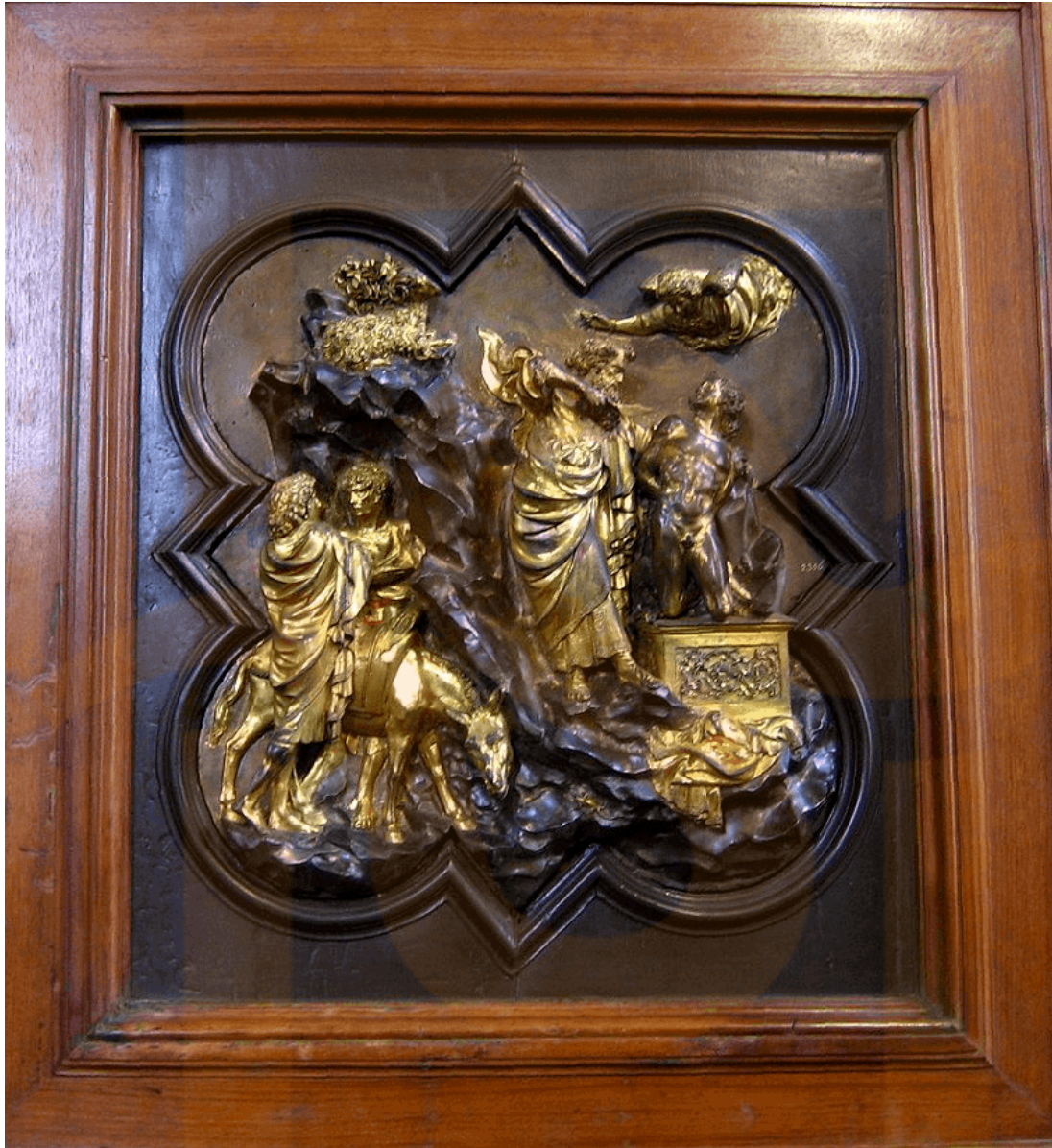
Figura 4: El sacrifici d'Isaac , la peça presentada al concurs per decorar les portes septentrionals del baptisteri de Florència. Obra de Ghiberti. Actualment, al Museu Bargello.