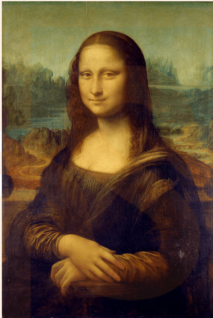
Figura 10: La Gioconda , de Leonardo da Vinci.