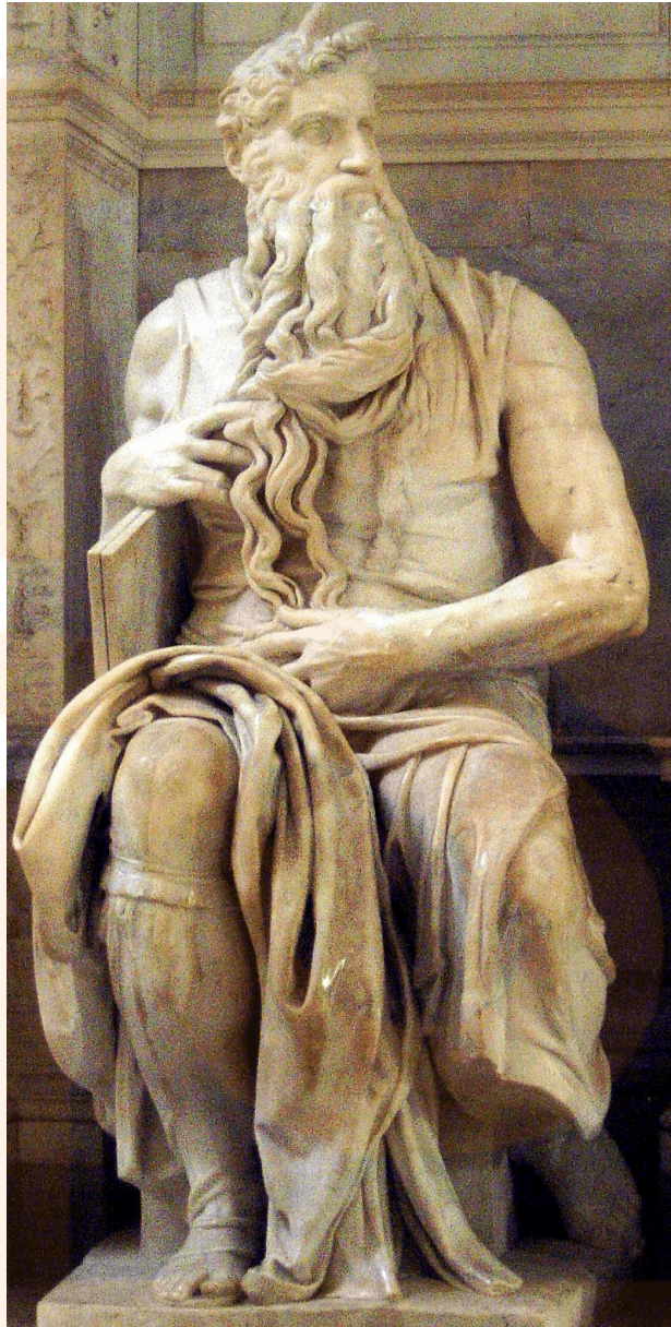
Figura 9: Moisés . Mauseoleu de Juli II. Miquel Àngel.