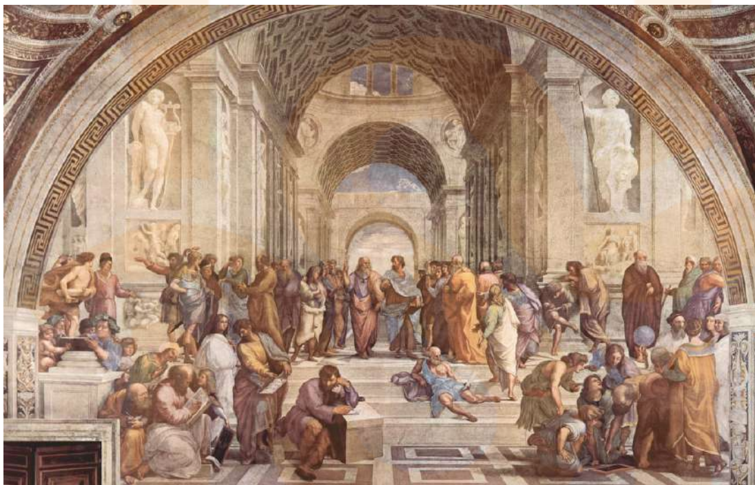
Figura 2: L'escola d'Atenes , fresc de Rafael.