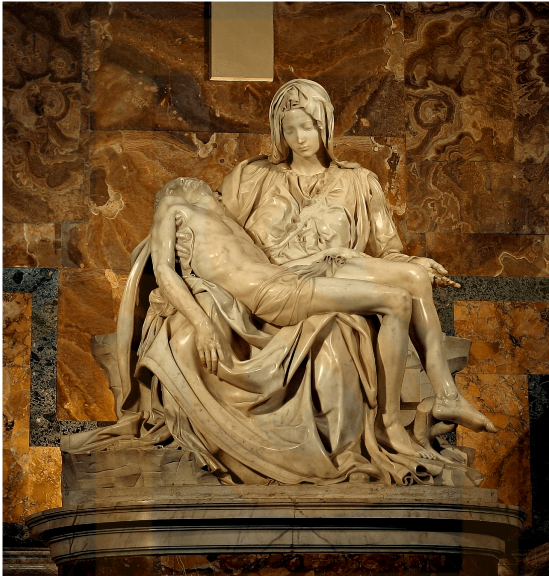
Figura 15: La Pietà , de Miquel Àngel