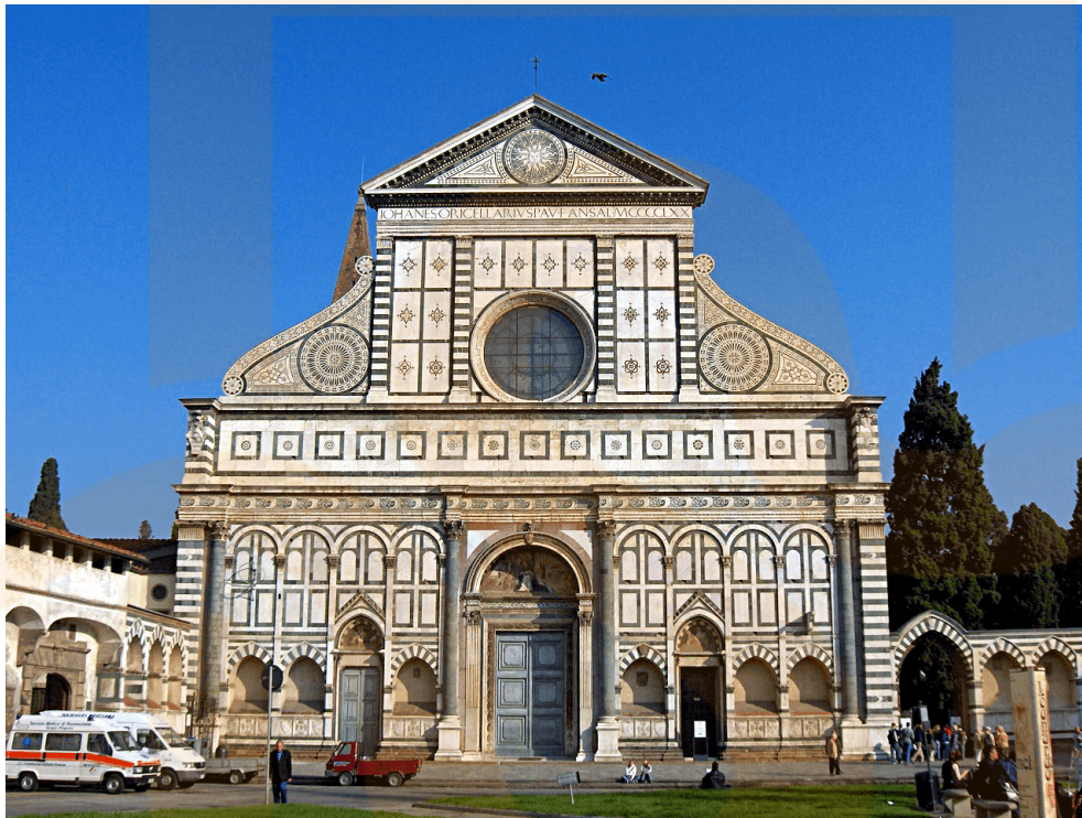
Figura 6: Santa Maria Novella, Florència. Per encàrrec de Rucellai, el 1456 Alberti projectà la finalització de la façana de l'església de Santa Maria Novella, que havia quedat inacabada el 1365 al primer nivell d'arcades.