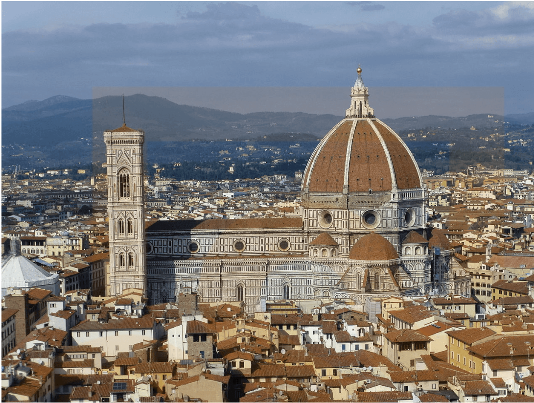
Figura 5: Santa Maria del Fiore, amb la cúpula dissenyada per Brunelleschi.

cúpula de la catedral de Florència. Però serà també el responsable de la invenció d'una abstracció gràfica que determinarà la pintura d'Occident fins al segle XIX, la perspectiva .