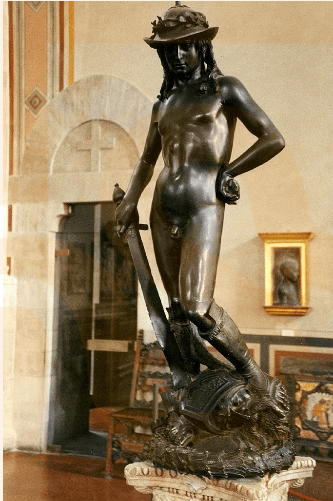
Figura 7: El David , de Donatello.