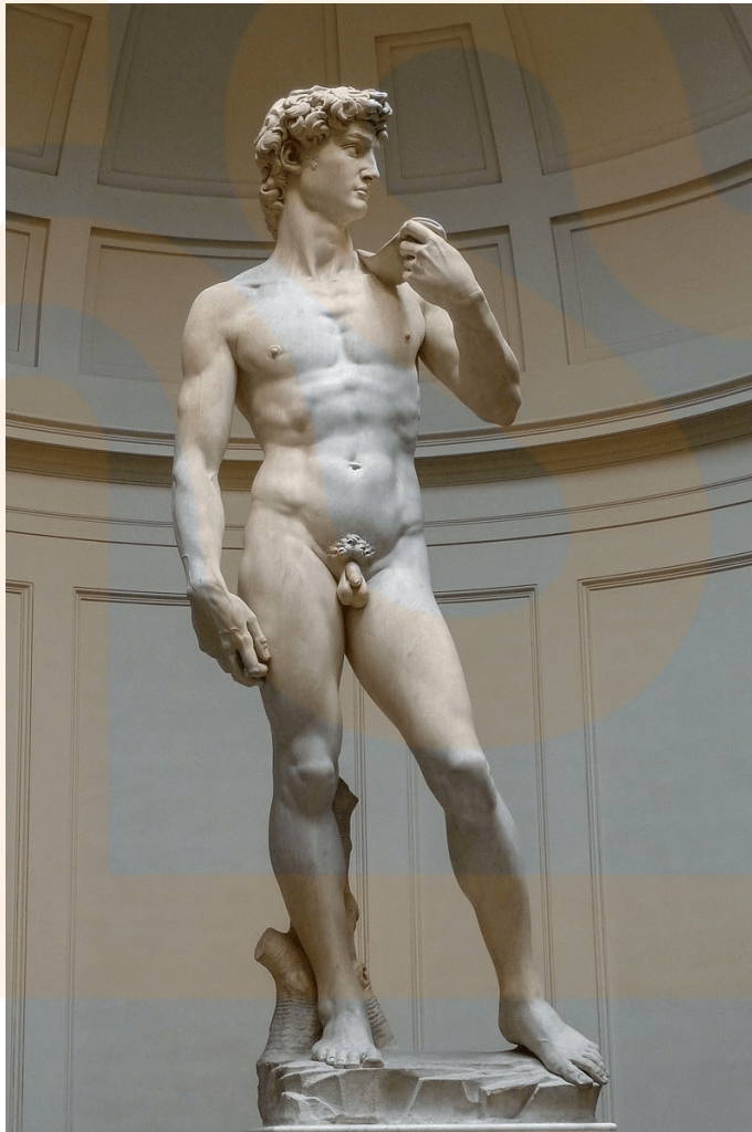
Figura 12: David , de Miquel Àngel.

En primer lloc cal parlar de la força com a element dominant del llenguatge artístic de Miquel Àngel. El David o el Moisés de la tomba del papa Juli II. Però aquesta força no es limitarà només a l'escultura. La podem reconèixer a les pintures del sostre de la Capella Sixtina, on els personatges que ocupen les diferents escenes estan representades amb un llenguatge escultòric, volumètric. Però no només està la força, sinó en l'expressió del cos humà. Les posicions són cada vegada més agosarades, complexes, tenses, mai vistes abans. La representació de la forma estava per sobre del tema representat. I aquesta obsessió cap a la forma inaugurarà el Manierisme .