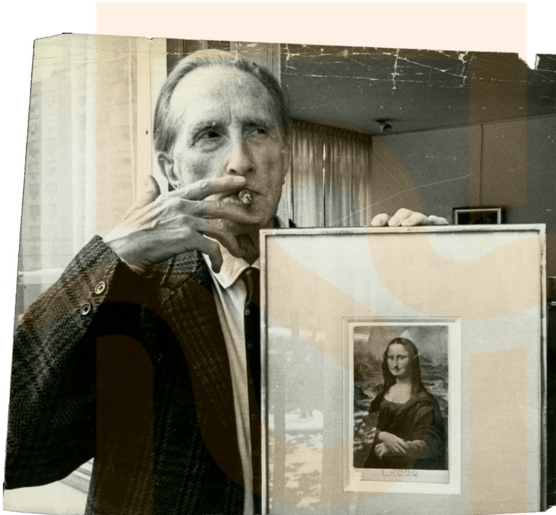
Figura II: L.H.O.O.Q. , per Marcel Duchamp.