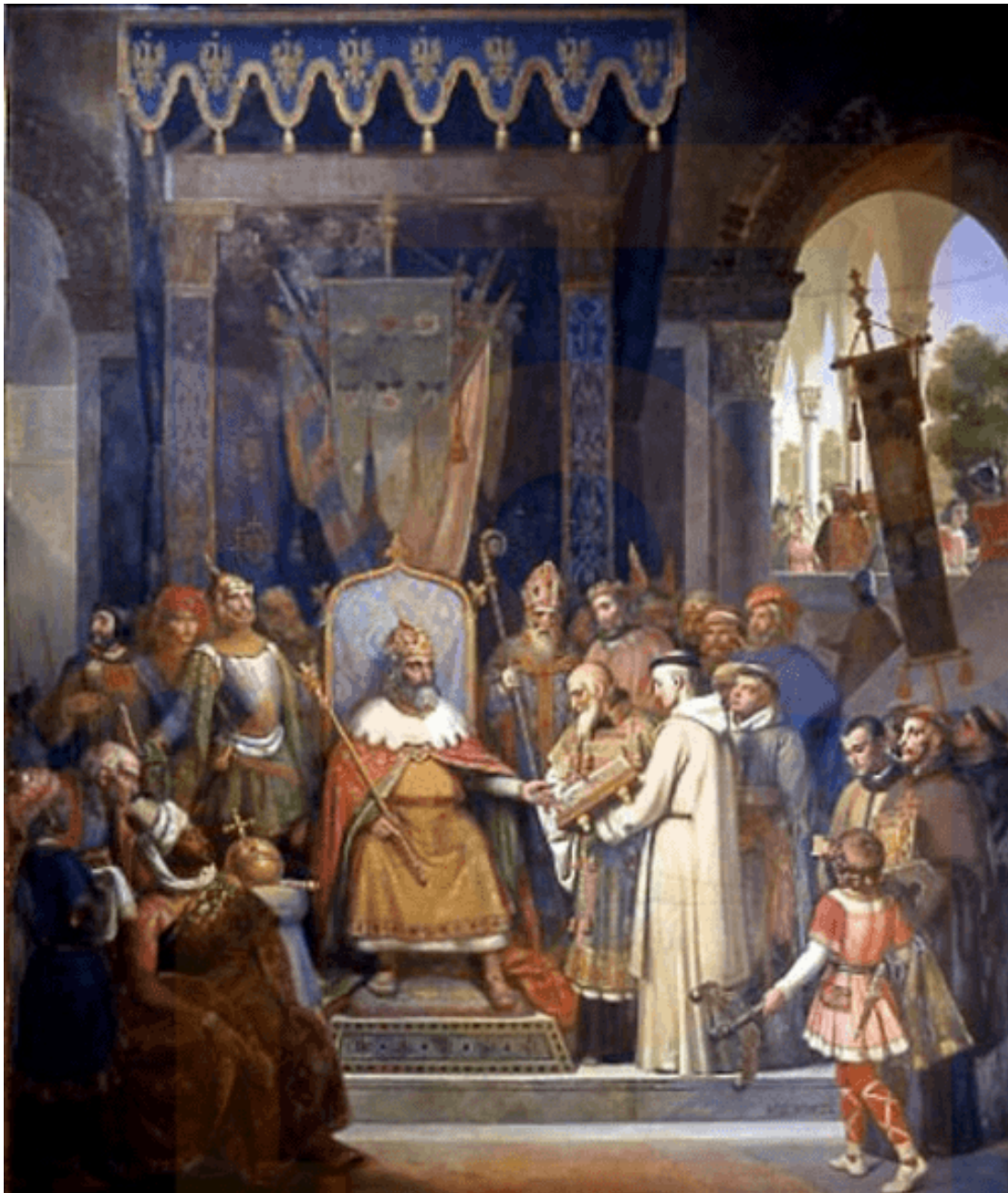
Figura 1: Carlomagne, envoltat dels seus principals col·laboradors, rep Alcuí de York que li presenta els manuscrits escrits pels seus monjos. Obra de Victor Schnetz.