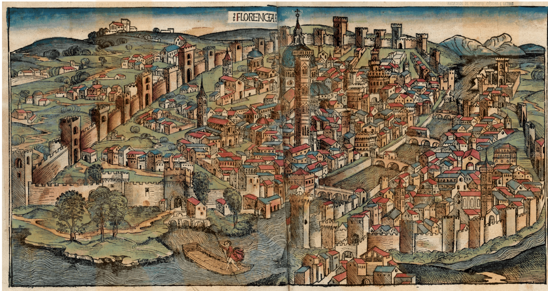
Figura 3: Xilografia de de la ciutat de Florència a l'any 1493, de Hartmann Schedel.

Al segle XV, si bé ens referim sempre a Itàlia com a zona geogràfica on va produir-se, consolidar-se i propagar-se el Renaixement, existien només ciutats-estats (Itàlia, com a territori políticament i socialment unificat, no esdevindrà fins al segle XIX) amb un poder econòmic i polític molt important. D'aquesta ciutat-estat cal assenyalar en primer lloc Florència. En aquells moments, Florència representava la ciutat-estat més avançada d'Europa si entenem per aquella que sobresurt (i s'escapa) del context medieval. És, per això que, el primer Renaixement conegut com a Quattrocento es situarà a Florència.